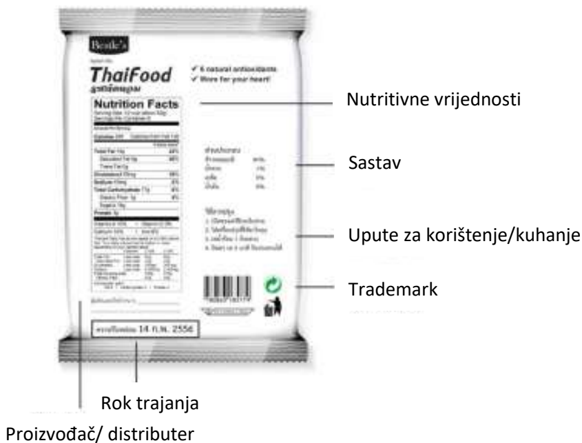
Slika 4. Grafički elementi na pakiranja (stražnja strana)