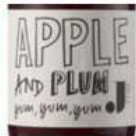
Slika 9. Samo tekst