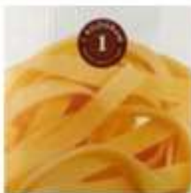
Slika 6. Fotografija