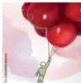
Slika 8. Fotografija i ilustracija