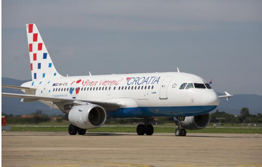
Slika 2. Zrakoplov Airbus 320