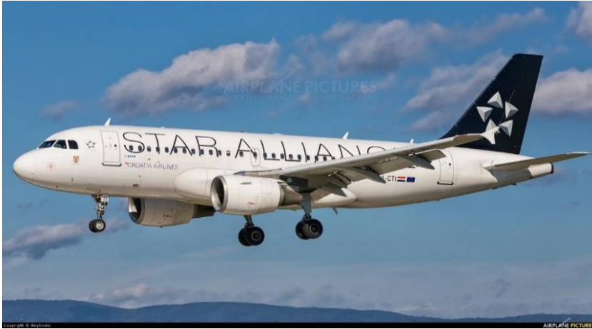
Slika 1. Zrakoplov Airbus CTI

amortizaciju i akumulirane gubitke od umanjenja vrijednosti. Revalorizacija se provodi dostatnom učestalošću kako knjigovodstvena vrijednost ne bi značajno odstupala od one koja bi bila utvrđena korištenjem fer vrijednosti na datum izvještavanja.“ (Croatia Airlines d.d.)