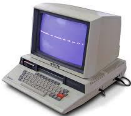
Slika 2. Računalo 1999. godine

2000. godine, sve više poslovanja uvodi makar jedno računalo, no računalo nije bilo toliko povezano s ostalim računalima. Programi su bili nešto slabiji, kao i njihova zaštita, te su se tvrtke više bazirale na papir. Određene razvijene tvrtke su uz računalo, u svom poslovanju posjedovale i printer (pisač). Prvi printeri razvili su se davne 1938. godine i otada se radilo na sve novijim vrstama printera. Prije 1988. godine, printer je bio slabo dostupljen, rijetki su ga mogli priuštiti. Nakon 2000. godine, određene tvrtke uz računalo, u svoje poslovanje, osim printera, uvode i skenere. Sve su to inačice starih printera. Prije veće zastupljenosti ove dvije tehnologije, samo su određeni posjedovali printer. Za kopiranje, poslodavci su svoje spise nosili u obližnji studio i kopirali. Uvođenje printera i skenera, uštedilo je vrijeme odlaska do obližnje kopiraonice. Ne može se točno odrediti koji je datum masovnog korištenja i uvođenja računala u poslovanje, ali nakon 2014. godine, sve više poduzeća koristi sve više računala u svojem poslovanju. Može se primijetiti i razlika između određenim računalima.