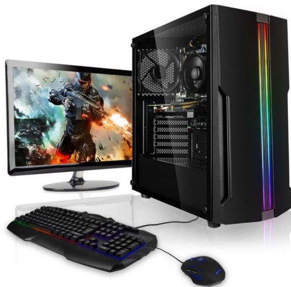
Slika 3. Računalo 2021. godine