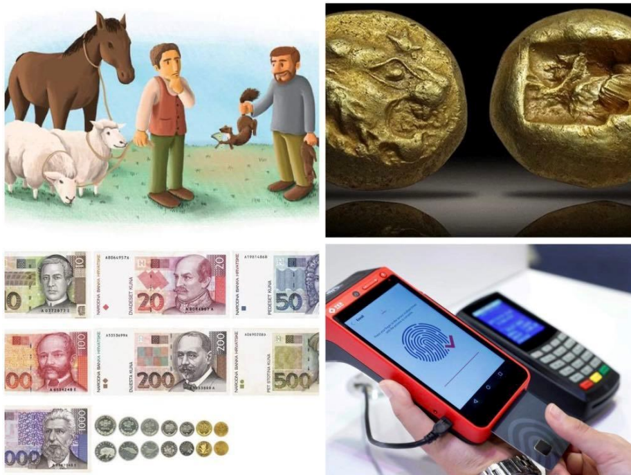
Slika 1. Oblici novca kroz povijest