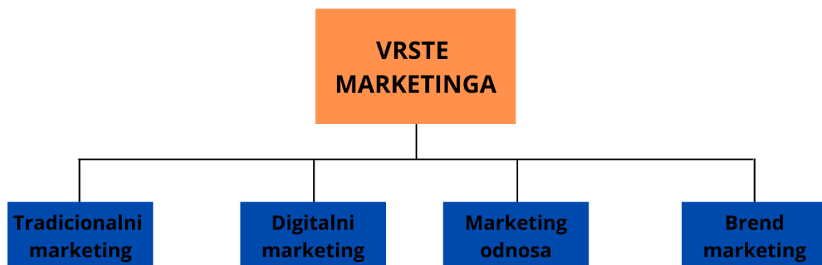
Slika 1: Vrste marketinga (Corporate Finance Institute, 2020.)

„Uvijek će, može se pretpostaviti, postojati potreba za nekom prodajom. Ali cilj marketinga je učiniti prodaju suvišnom. Cilj marketinga je upoznati i razumjeti kupca tako dobro da mu proizvod ili usluga odgovara i da se prodaje“ (Drucker, 1973: 64-5). Ukoliko stručnjak za marketing kvalitetno odradi posao prilikom prepoznavanja potreba kupaca, uspije razviti proizvod koji ima veću vrijednost i provede dobru promidžbu, taj će se proizvod lako prodavati. I samim time to znači kako su i prodaja i oglašavanje dio marketinga.