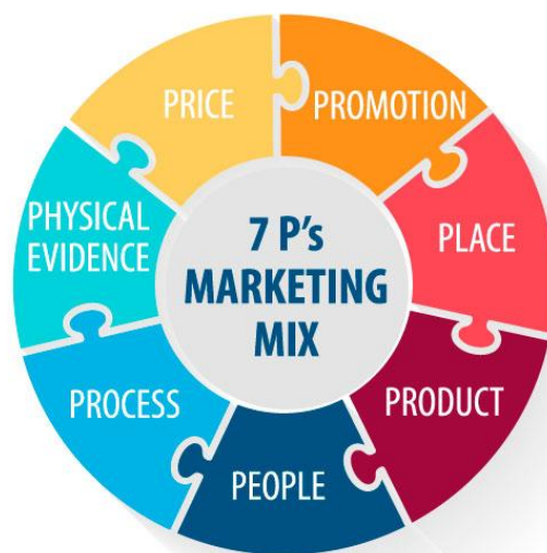
Slika 2: 7P model u marketingu (TopOnSeek, 2022.)

Kako navodi portal The Economic Times (2022), marketinški miks odnosi se na skup akcija ili taktika koje tvrtka koristi za promoviranje svoje robne marke ili proizvoda na tržištu.