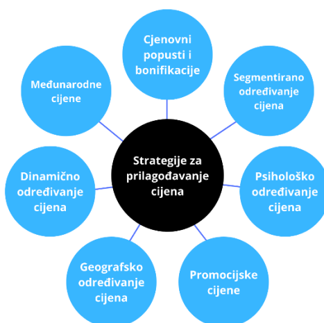
Slika 4: Strategije za prilagođavanje cijena (Marketing-Insider, 2015.)

Poduzeće treba uzeti u obzir sve čimbenike te na temelju istih donijeti odluku o cijeni proizvoda/usluge.