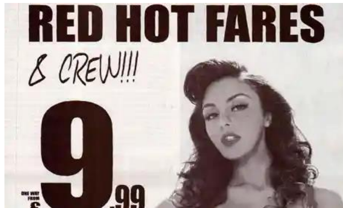
Slika 6. : Oglas Ryanaira koji je zabranjen od strane Advertising Standards Authority . (The Guardian, 2012.)