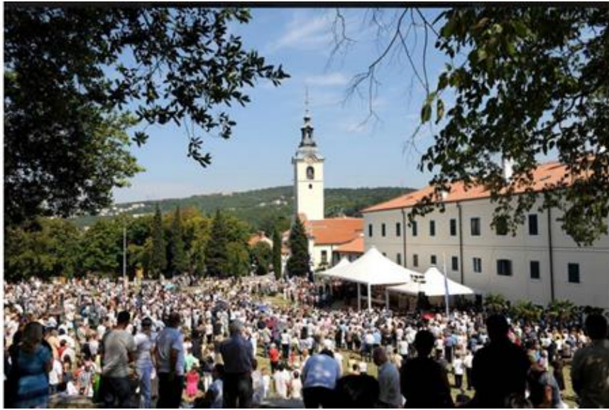
Slika 3. Svetište Gospe Trsatske