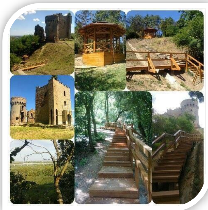
Slika 4. Poučna staza u Erdutu

Malo mjesto Erdut, po kojem je Općina i dobila ime, skriva prekrasne znamenitosti koje, nažalost, nisu dobro prezentirane kroz turističke zajednice. Mjesto Erdut ne posjeduje poučnu stazu koja je nazvana „stepenicama zdravlja“, nego i prekrasnu stražarsku kulu sa koje se pruža predivan pogled na rijeku Dunav. Erdut je mirno mjesto koje se prvi put spominje negdje oko 15. stoljeća, a do danas se ne zna kada je izgrađeno i tko ga je izgradio. Prepun je priča koje se protežu još iz davnina i svakako je poželjna atrakcija za domaće i strane turiste. Erdutska kula ima dugu povijesnu priču koja može biti atrakcija ukoliko se poradi na promoviranju kulturnog turizma Općine Erdut. Tijekom godine, na kuli se održavaju brojni događaji, pa tako i obilježavanje obljetnice Oluje, natjecanje u kulinarnstvu, razni sajmovi i drugo. Erdutska kula je pogodna i za razne vrste piknika koji se održavaju tokom godine. Također, mjesto Erdut je smješteno na većoj nadmorskoj visini i gledanje zvijezda je nezaobilazan doživljaj koji se može ponuditi. S obzirom kako je pristanište brodova nedaleko od mjesta Erdut, turisti koji dolaze u obilazak Vukovara i Osijeka, nezaobilazno bi trebali imati rutu koja obuhvaća i općinu Erdut i njegove znamenitosti i priče.