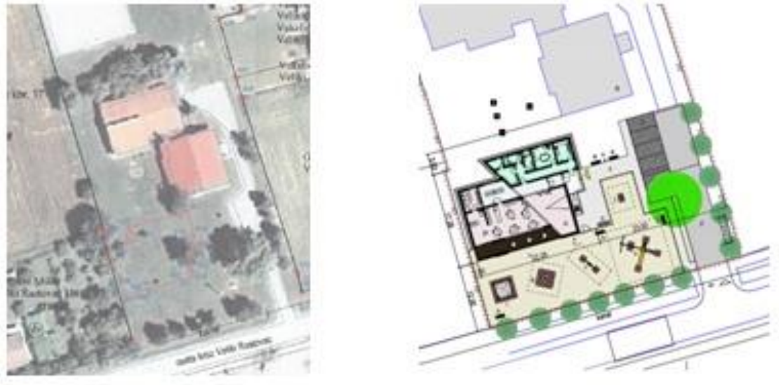
Slika 1. Zemljište predviđeno za izgradnju vrtića i tlocrt vrtića

Dječji vrtić je samostojeća građevina. Pristup vrtiću osiguran je prilaznim putevima (kolni i pješački). Na slici 1 prikazan je izvadak iz katastarskog plana i tlocrt objekta, a na slici 4 prikazana je 3d verzija objekta iz građevinskog projekta.