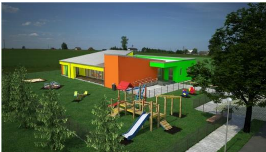
Slika 2. Dječji vrtić „Lipa“ u Velikom Rastovcu – izvadak iz projektne dokumentacije