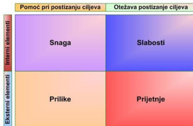
Slika 1: SWOT analiza