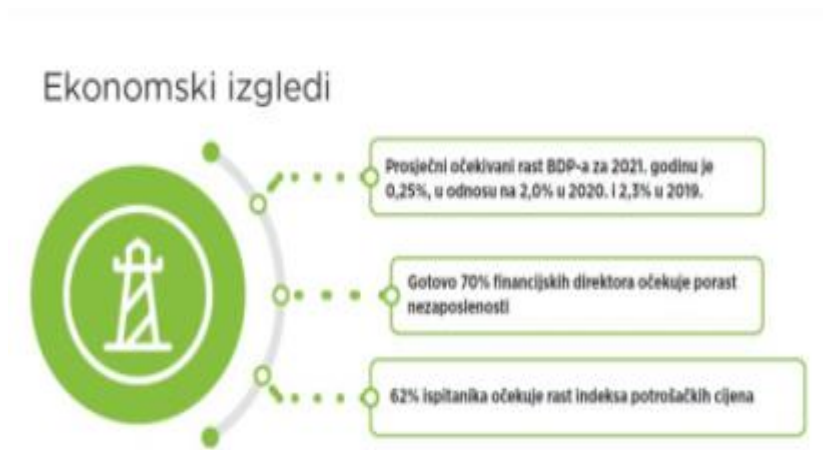
Slika 4: Ekonomski izgledi