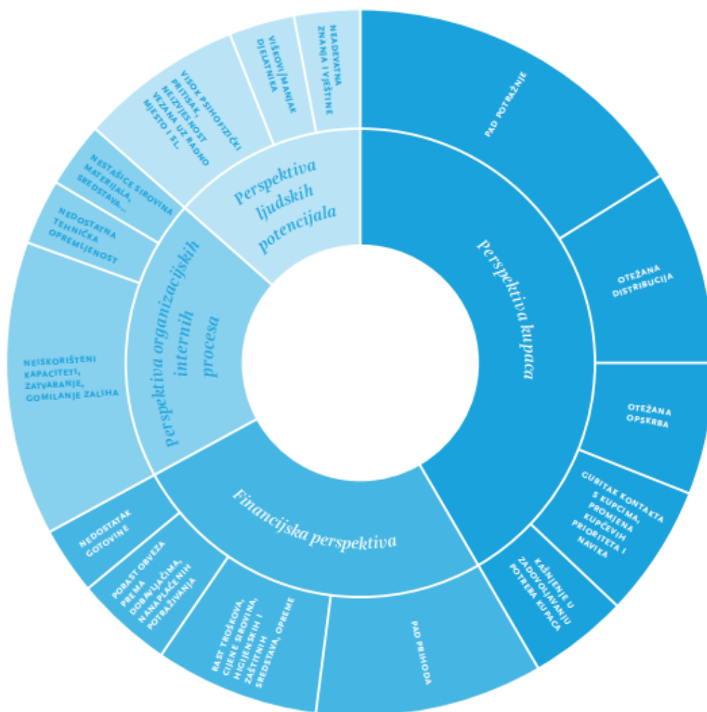
Slika 2.: Problemi u poslovanju izazvani prvim valom pandemije Covid-19

Izvor: Pfeifer et.al (2021.) , Reakcije poduzeća na prvi val pandemije COVID-19. Primjeri dobre prakse. Dostupno na: http://www.efos.unios.hr/wp-content/uploads/2021/04/EFOS-ReakcijaPoduzecaNaPrviValPandemije-brosura-0425-small.pdf