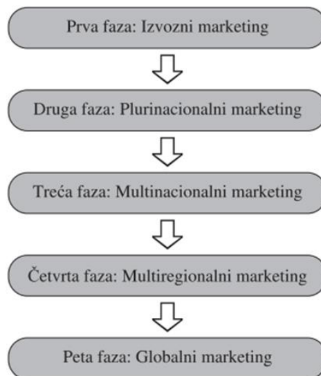
Slika 1: Faze razvoja međunarodnog marketinga(Grbac, 2009.)

Za globalni marketing, može se reći da predstavlja standardizaciju i integriranje marketinških aktivnosti u svrhu zadovoljenja potrošača na međunarodnom tržištu. On čini značajan dio poslovne strategije poduzeća, te kako bi bio ispravno izveden treba voditi računa o njegovim elementima. Unutarnji elementi nad kojima tvrtka ima kontrolu su poznavanje marketinga, financijska sposobnost poduzeća, prijašnje iskustvo zaposlenika te elementi marketing miksa: proizvod, cijena, promocija i distribucija. Vanjski elementi, na koje poduzeće ne može utjecati, su ekonomski, političko-pravni, kulturni utjecaji i konkurencija. Kako bi se uspješno nosili s elementima, potrebno je kontinuirano pratiti promjene na tržištu i provoditi analizu postojeće situacije.