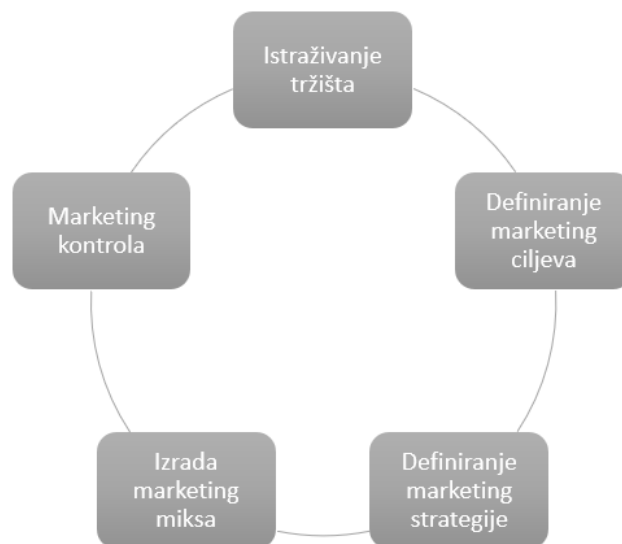
Slika 3: Marketing proces (prema Meler, 2005.)

dinamičnih promjena koje su rezultat različitih društvenih radnji. Grbac smatra kako poseban utjecaj dolazi od tehnoloških promjena koje su omogućile fleksibilnost u stvaranju, ali i u jednostavnom uočavanju razlika u ponudi pojedinih poslovnih subjekata na međunarodnom tržištu. Promjene su posljedica novog reagiranja krajnjih potrošača i poslovnih kupaca i jačanja konkurencije na međunarodnoj razini. Poslovni subjekti u nastupu na međunarodnom tržištu moraju preduhitriti konkurenciju u razumijevanju tržišnih potreba, odnosno načina dodavanja vrijednosti proizvodima i uslugama, kako bi bili što atraktivniji potencijalnim krajnjim potrošačima i poslovnim kupcima te ispunili, pa i premašili, njihova očekivanja. Pogodnosti međunarodnog tržišta stimuliraju domaća poduzeća da svoj potencijal ostvare na stranim tržištima i suoče se s preprekama koje im ono donosi.