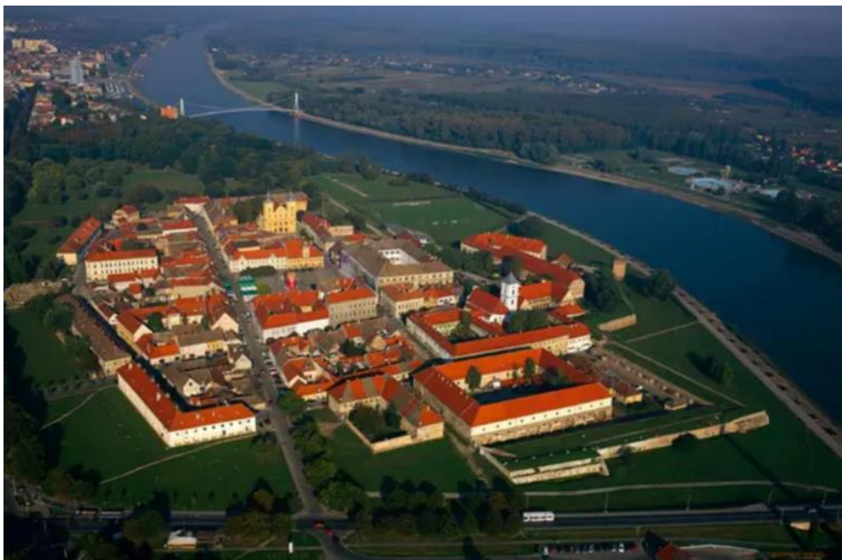
Slika 1. Osječka Tvrđa

Nakon Domovinskog rata veliki dijelovi Osječko-baranjske županije nisu bili dio Republike Hrvatske sve do 1998. godine (Turistička zajednica OBŽ-a, n.d.). Iz tog razloga je gospodarstvo doživjelo pad.