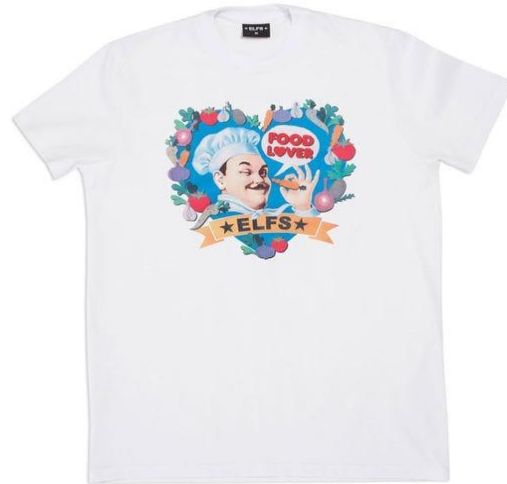
Slika 7. Suradnja ELFS-a i Podravke