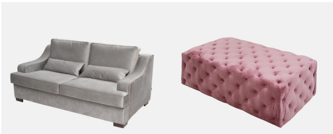
Slika 5. ELFS home namještaj

Kao što je već spomenuto, ovaj neobični modni brend ELFS u svojoj ponudi, osim odjeće i obuće koju naravno svaki modni brend mora imati, sadrži i svoju home liniju proizvoda. Ova neobična ponuda, prije svega za modne dizajnere, je definitivno prednost u odnosu na konkurentske modne brendove jer ljudi osim odjevnih kombinacija imaju na raspolaganju kupiti i nešto za njihov dom. ELFS je ovu liniju proizvoda izbacio 2018. godine te od namještaja na njihovoj web stranici nude: fotelju, dvosjed i tabure. Dizajn namještaja je kao i ELFS-ov stil: neobičan i elegantan te slika 5 prikazuje izgled dvosjeda i taburea ELFS.