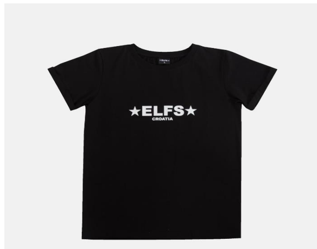
Slika 3. Primjer logomanije ELFS-a

modni brend ideje za kreacije ima i na temelju svjetski poznatih modnih brendova, ikona ali i „uličnih“ brendova koje se svakodnevno mogu vidati te tako predstavljaju što je to „in“ na tržištu modne industrije. Ono što također karakterizira ELFS je i originalnost te njegove kreacije zasigurno neće biti slične ili iste kao u konkurentskih modnih brendova. U svojim kreacijama modni dvojac forsira logomaniju, odnosno naglašava svoj logo brenda te ga stavlja u prvi plan. Klasičan primjer logomanije ovoga brenda su majice koje imaju veliki natpis ELFS te je to glavni detalj na njima, a slika 3 upravo prikazuje primjer jedne takve majice.