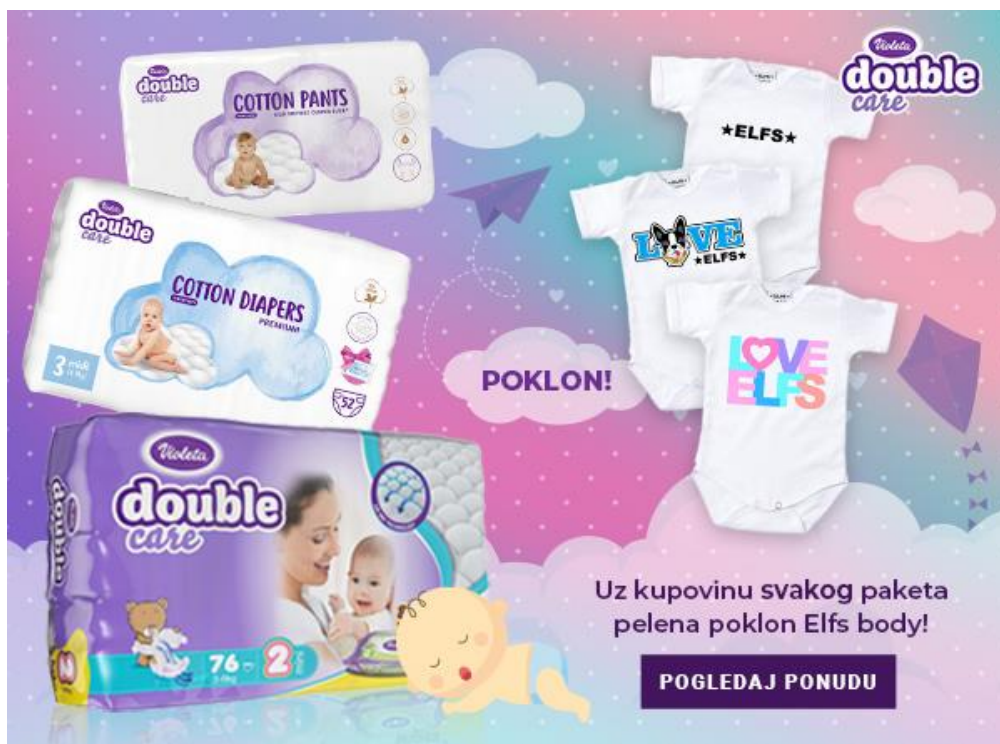
Slika 8. Poklon ELFS body u suradnji s Violetom