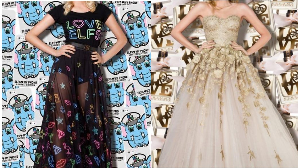
Slika 4. Modni proizvodi brenda ELFS