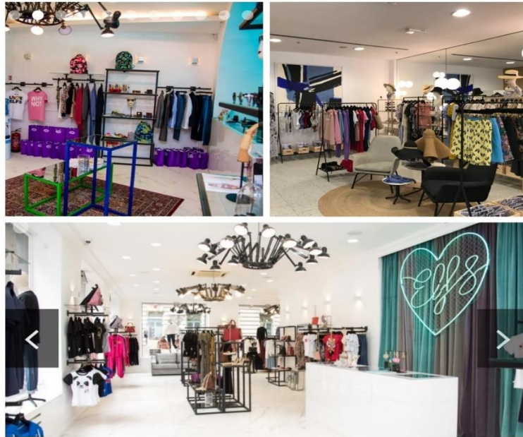
Slika 6. Interijer trgovina ELFS