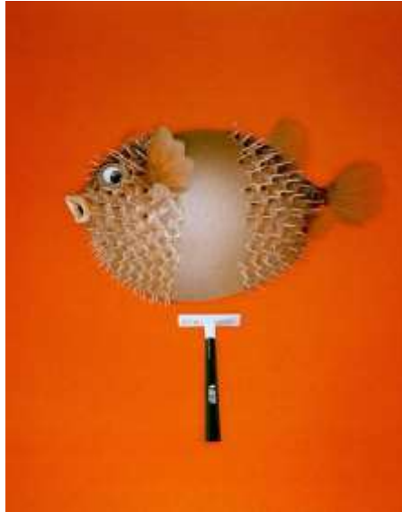
Slika 1. Primjer kreativnog oglasa (dostupno na: https://www.pinterest.com/pin/70437486143048/ )