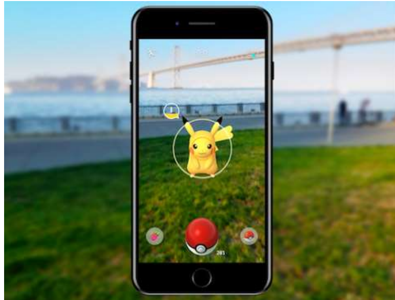
Slika 6. Aplikacija Pokemon Go (dostupno na: https://niantic.helpshift.com/hc/en/6-pokemon-go/faq/28-catching-pokemon-in-ar-mode/ )

aktivnih mobilnih korisnika koji se služe AR tehnologijom je 810 milijardi. Kako navodi Javornik (2016.), prva komercijalna AR aplikacija razvijena je 2008. godine u svrhu oglašavanja jedne njemačke agencije, dok je značajan porast tehnologija doživjela s aplikacijom Pokemon Go koja je 2016. godine doživjela vrhunac, a paralelno s njom se razvijala i aplikacija Snapchat.