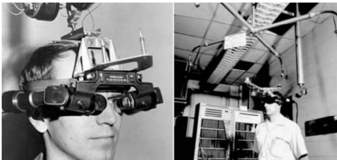
Slika 4. Uređaj Ivana Sutherlanda „ Helmen Mounted Display (HMD) “ (dostupno na: file:///C:/Users/karla/Downloads/norman_kodan - prosirena stvarnost%20(1).pdf )

Proširena stvarnost je po prvi puta, u određenoj mjeri, postignuta od strane kinematografa zvanog Morton Heilig 1957. godine. Heilig je izumio Sensoramu koja je gledatelju isporučivala vizualne slike, zvukove, vibracije i mirise, no iako uređaj nije bio računalno upravljani, bio je prvi pokušaj dodavanja dodatnih vrijednosti iskustvu korištenja. Nakon toga je američki računalni znanstvenik Ivan Sutherland 1968. godine izumio zaslon koji se montira na glavu te predstavlja tzv. „prozor u virtualni svijet“. S obzirom na razdoblje u kojemu je uređaj izumljen, korištenje takve tehnologije bilo je nepraktično za masovnu upotrebu.