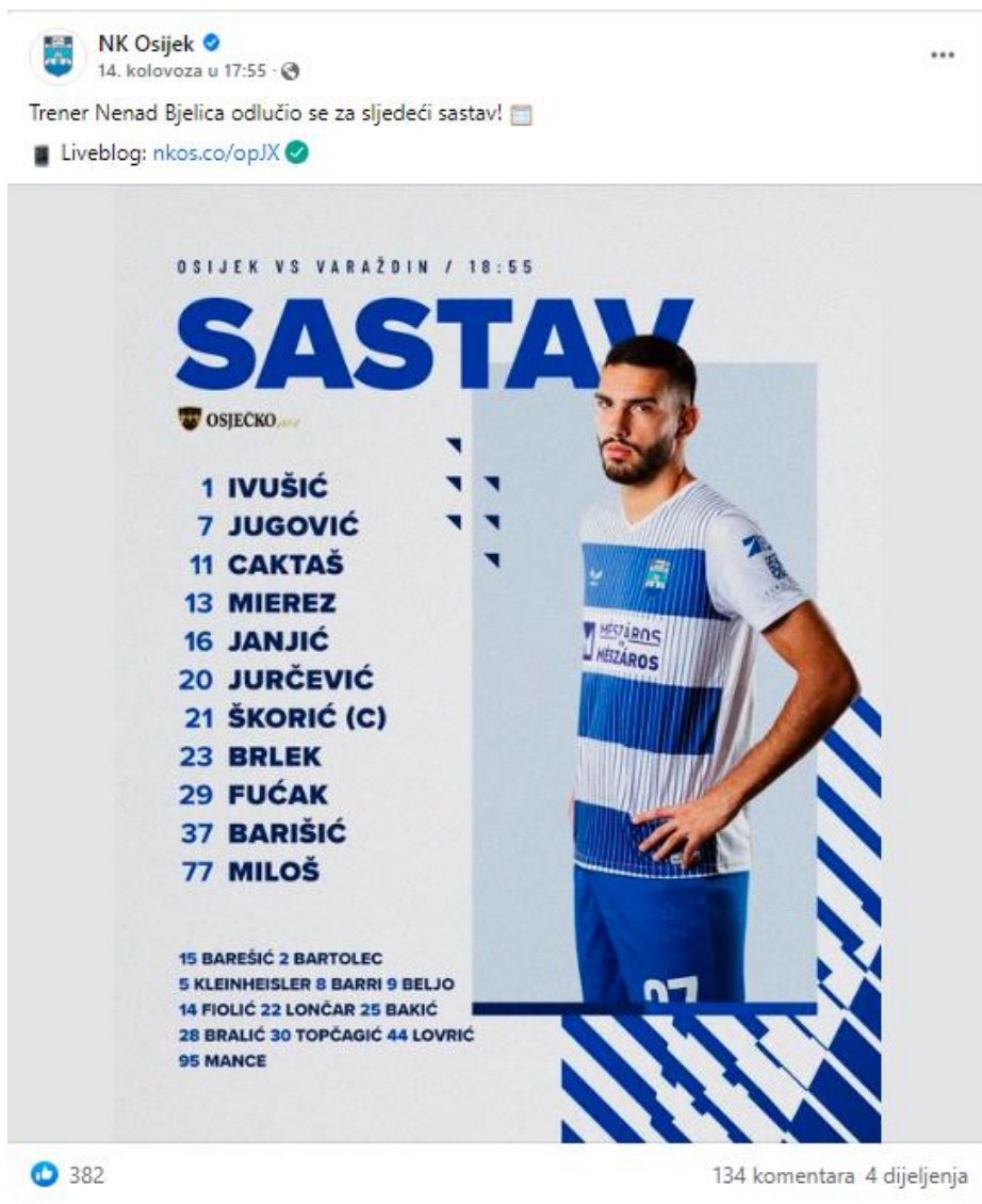
Slika 11: Izgled Facebook objave službenog profila NK Osijek Preuzeto sa: https://www.facebook.com/nkosijek (18.8.2022.)

započeti na klupi. Kao i kod Dinama, i ovdje postoji igrač koji je obučen u dres koji će ekipa nositi na predstojećoj utakmici. Dizajn je specifičan i korišten je u svim objavama kada je riječ o domaćim utakmicama. Na fotografiji može se vidjeti mali logotip Osječke pivovare koja je sponzor nogometnog kluba. Objava je prikupila 382 reakcije "sviđa mi se", komentirana je 134 puta, a podijeljena 4 puta.