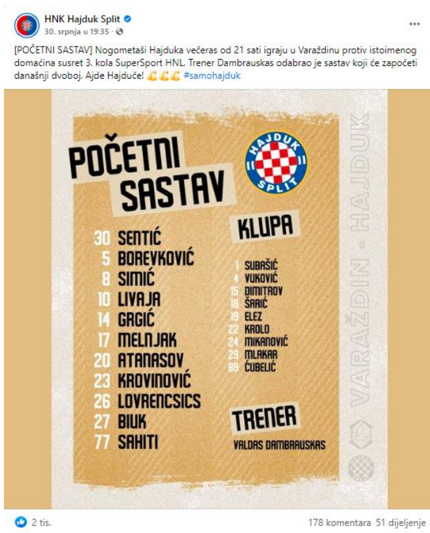
Slika 8: Izgled Facebook objave službenog profila HNK Hajduk Split Preuzeto sa: https://www.facebook.com/hnkhajduk (18.8.2022.)

Što se Twittera tiče slikovni sadržaj je identičan onome na Facebooku. Razlika postoji u tekstualnom dijelu gdje su objavljena samo dva hashtaga. Putem Twittera Hajduk je dobio 35 reakcija "svidi mi se", 2 komentara te 2 dijeljenja objave.