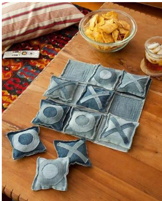
Slika 4: križić-kružić igra od reciklirane odjeće