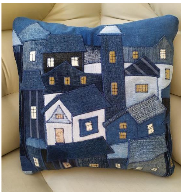
Slika 2: jastučnica od reciklirane odjeće