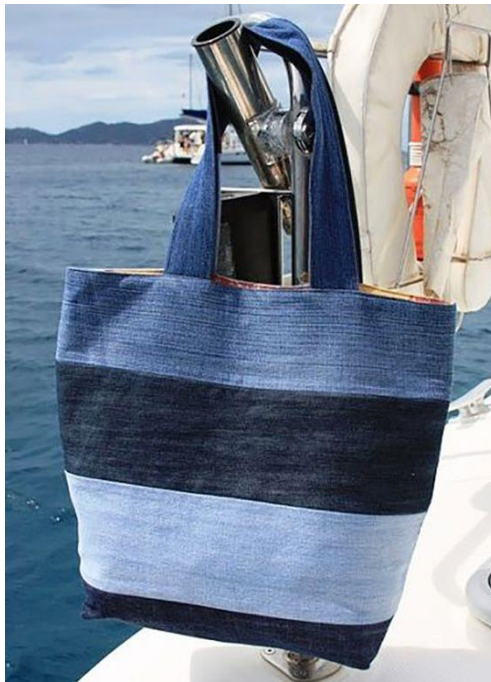
Slika 3: torba od reciklirane odjeće