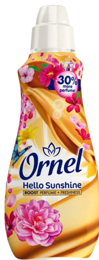
Slika 5. Ornel omekšivač danas.