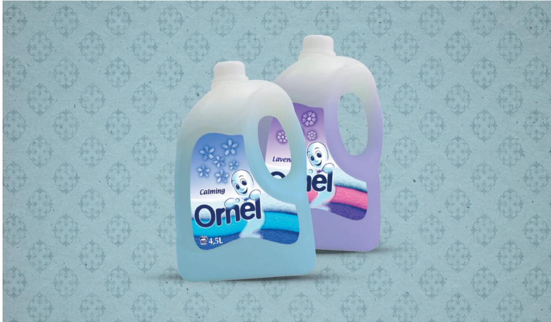
Slika 4. Ornel omekšivač – retro.