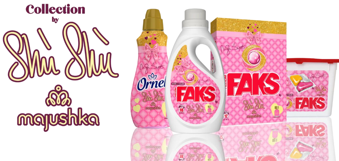
Slika 3. Faks i Ornel Shù Shù .

šteti okolišu, a opet da ima svoju visoku funkcionalnost pri zaštiti samog sadržaja kutije te da deterdžent ne gubi svoja svojstva i kvalitetu. Kako je vrijeme prolazilo, tako su se želje i potrebe ljudi povećavale, a ujedno se povećala konkurencija pa se iz ukupne mase ponuđača treba istaći. Saponia se zadnjih godina posebno ističe sa svojim inovacijama praškastog i tekućeg deterdženta Faks Helizima i Ornela . Tako je zadnja inovacija bila Faks i Ornel Shù Shù (Slika 2.).