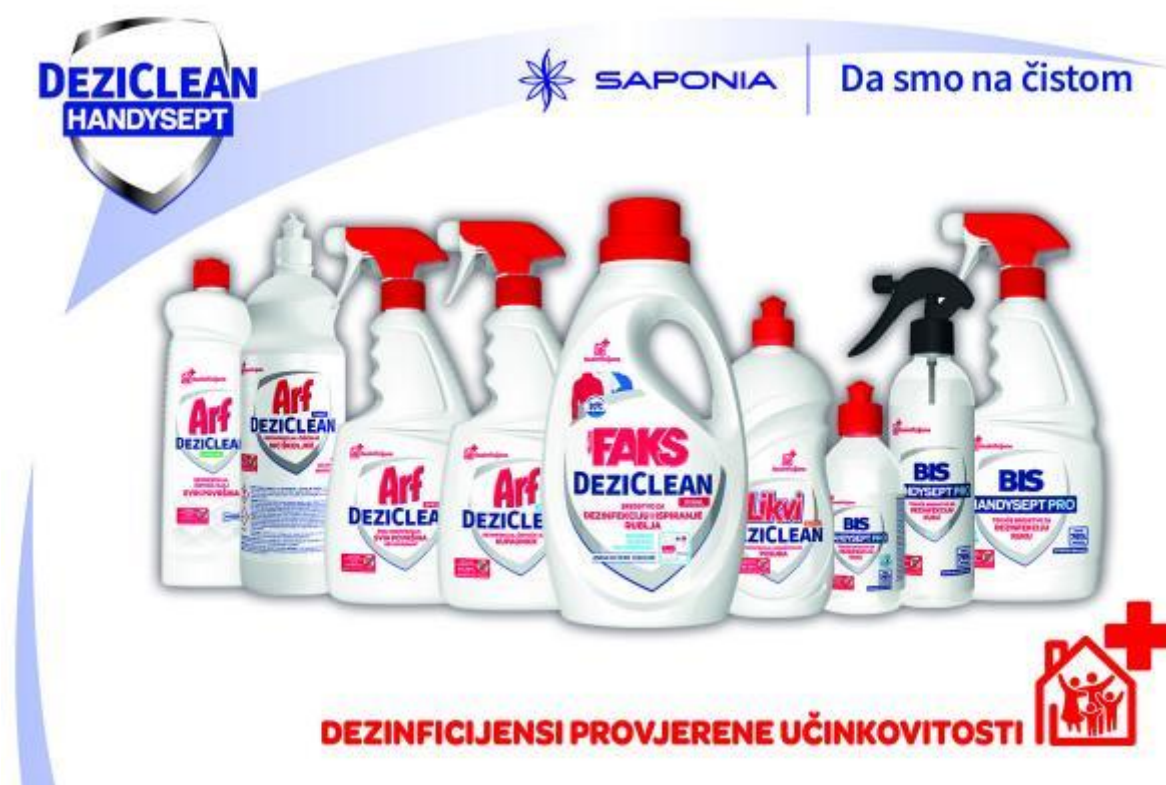
Slika 6. BIS HANDYSEPT i ARF DEZI-CLEAN .

Osim konstantnog inoviranja postojećih proizvoda, „Saponia se, od pojave koronavirusa, potvrdila kao proizvođač koja je među prvima, pokrenula proizvodnju dezinficijensa i omogućila ustanovama i građanima neophodna sredstva za zaštitu zdravlja“ (Saponia, 2020). BIS HANDYSEPT i ARF DEZI-CLEAN našli su se na prvoj crti borbe s COVID-19 virusom te je dokazana njihova djelotvornosti te ubija čak 99,99% bakterija. ARF DEZI-CLEAN u svojoj ponudi nudi: tekuće sredstvo za dezinfekciju i čišćenje vodoperivih površina, sredstvo za dezinfekciju i čišćenje vodoperivih površina, sredstvo za dezinfekciju i ispiranje rublja, tekuće sredstvo za dezinfekciju i čišćenje WC školjke, tekuće sredstvo za dezinfekciju i čišćenje kupaonica, osvježivač WC školjke, deterdžent za ručno pranje i dezinfekciju posuđa te maramice namijenjene za dezinfekciju i čišćenje svih perivih površina koje ne dolaze u neposredan doticaj s hranom. BIS HANDYSEPT linija proizvoda nudi: alkoholno sredstvo za dezinfekciju ruku, alkoholni gel za dezinfekciju i suho pranje ruku, alkoholne vlažne maramice namijenjene za dezinfekciju ruku i površina, hidratantna krema za ruke s ekstraktom nevena i kamilice te kruti i tekući sapun za pranje ruku s antimikrobnim djelovanjem (Slika 5.).