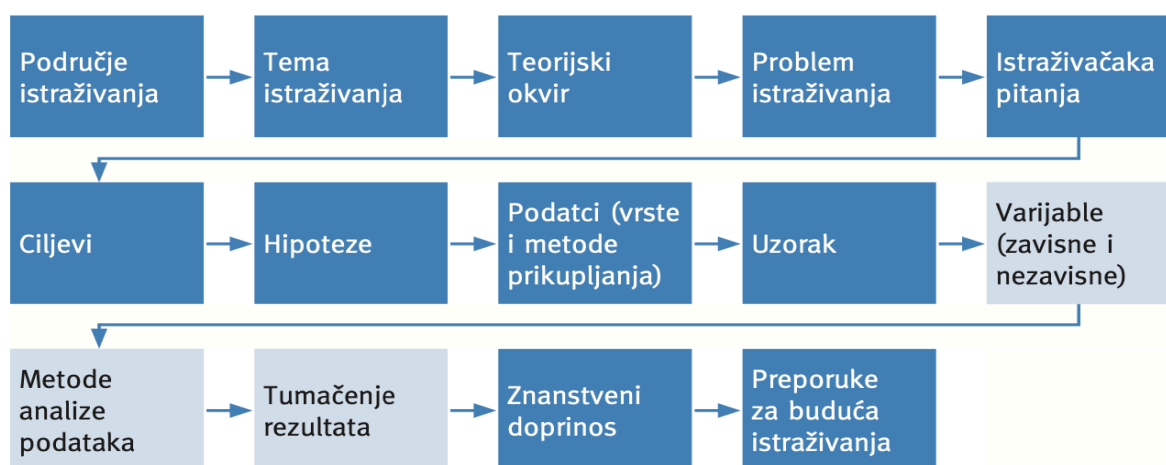
Slika 1: Istraživački proces

Uzorkovanje je dio kvantitativnog istraživačkog procesa (slika 1). „Istraživački proces temelji se na – prethodnim istraživanjima i izučavanju literature, odabiru metodologije istraživačkog rada, prikupljanju podataka i analizi podataka i tumačenju rezultata“ (Horvat i Mijoč, 2019:37). Uzorci se obično primjenjuju s namjerom kako bi se dobila slika o populaciji u cjelini, bez potrebe za promatranjem svakog člana te populacije.