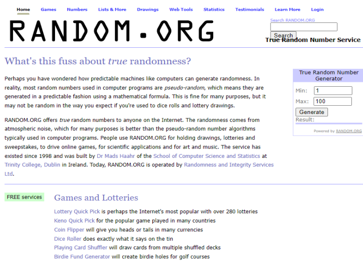
Slika 1. Primjer programa za generiranje slučajnog odabira random.org (Dostupno na: https://www.random.org , pristupljeno: 19. 9. 2022.)