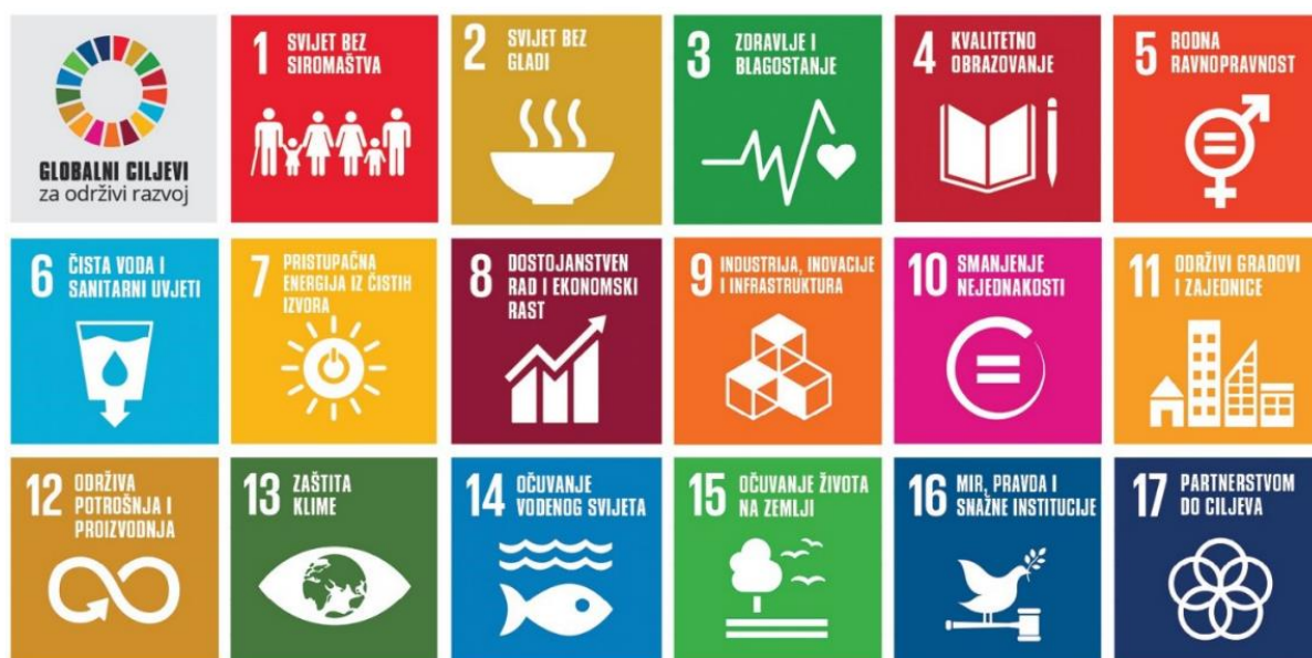
Slika 2. Globalni ciljevi održivog razvoja 2030, UN