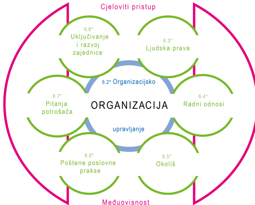
Slika 4. Društvena odgovornost: 7 glavnih tema