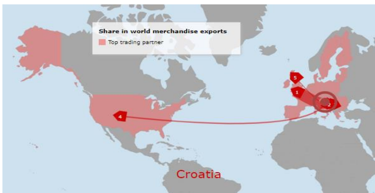
Slika 3 Izvoz Republike Hrvatske prema najvećim partnerima (www.wto.org, 2022.), [pristupljeno: 15. svibnja 2022].

Općenito gledano, u posljednje dvije godine Republike Hrvatska nije pokazala najbolje učinke u djelovanju unutar WTO-a. Prema podacima objavljenim u posljednjih nekoliko tromjesečja, vidljivo je kako RH bilježi lagani i blagi porast kroz mjesec. Za WTO taj porast je i zanemariv u odnosu na ostale članice, no potrebno je uzeti u obzir i stanje gospodarstva uzrokovano pandemijom COVID-19 u RH i u svijetu općenito.