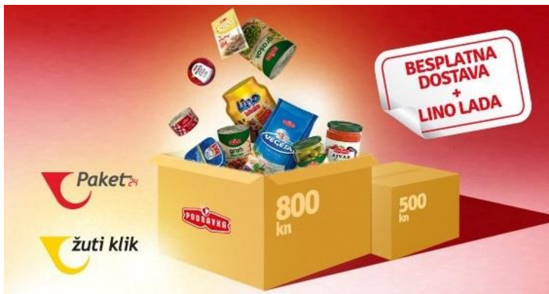
Slika 2. Suradnja Hrvatske Pošte i Podravke

No, osim paketa s prehrambenim namirnicama, Hrvatska Pošta koja je godinama glasila kao tvrtka koja se treba modernizirati i unaprijediti, ne zaostaje za globalnim trendovima kad su u pitanju ostale online narudžbe. Poduzeće petu godinu bilježi snažan godišnji rast te je sagradilo najveći i najsuvremeniji logistički centar u ovom dijelu Europe, čiji je kapacitet nosivosti 6400 tona paketa, odnosno obrada 15.000 pošiljki po satu (Večernji.hr, 2020).