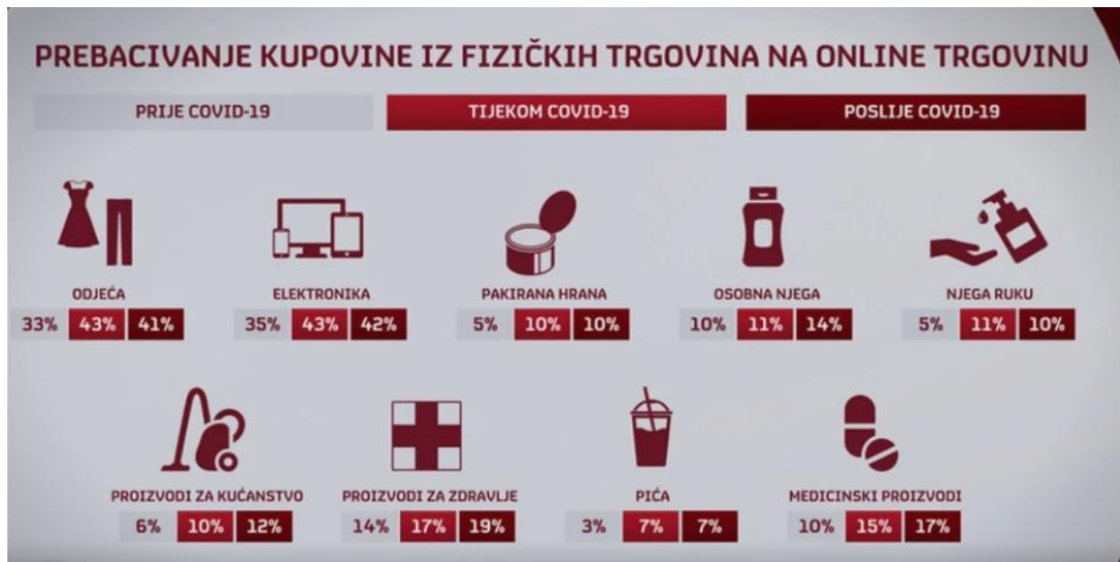
Slika 1. Prebacivanje kupovine iz fizičkih trgovina na online trgovinu- prikaz prema kategorijama proizvoda (razdoblje anketiranja 25.03.-02.04.2020.), izvor: Dnevnik.hr

Kao što navodi i dani prikaz na slici, gotovo dvije trećine potrošača navodi da troši više proizvoda za njegu ruku tijekom krize, a njih čak 40% izjasnila se kako će nastaviti tako istim intenzitetom. Prehrambene kategorije nastavile su rast jer domaćinstva više troše kod kuće.