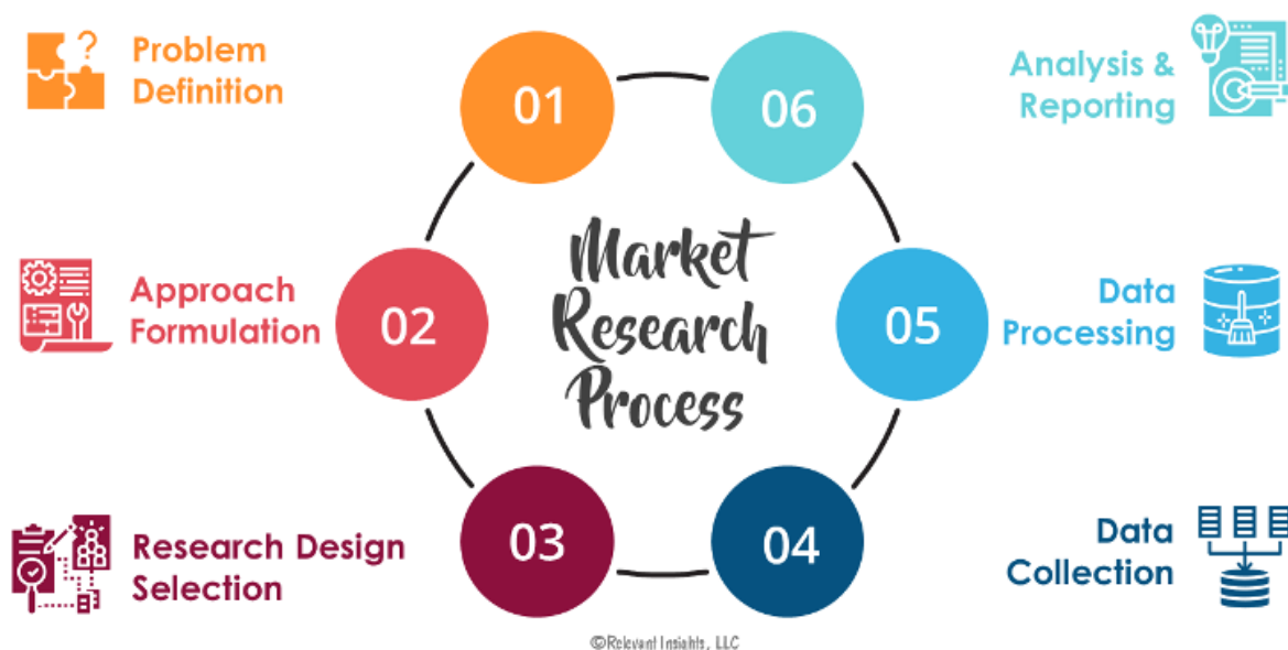
Slika 2. Proces istraživanja tržišta.

Mnoga poduzeća koriste istraživanje tržišta kako bi testirale nove proizvode ili kako bi dobile informacije od potrošača o tome koje vrste proizvoda ili usluga trebaju, a trenutno nemaju. Na primjer, tvrtka koja je razmišljala o pokretanju poslovanja mogla bi provesti istraživanje tržišta kako bi testirala održivost svog proizvoda ili usluge. Ako istraživanje tržišta potvrdi interes potrošača, tvrtka može s pouzdanjem nastaviti s poslovnim planom. Ako nije, tvrtka bi trebala koristiti rezultate istraživanja tržišta kako bi prilagodila proizvod kako bi ga uskladila sa željama kupaca. Postoji nekoliko vrsta istraživanja tržišta 22 :