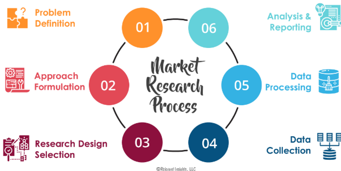
Slika 2. Proces istraživanja tržišta.

Mnoga poduzeća koriste istraživanje tržišta kako bi testirale nove proizvode ili kako bi dobile informacije od potrošača o tome koje vrste proizvoda ili usluga trebaju, a trenutno nemaju. Na primjer, tvrtka koja je razmišljala o pokretanju poslovanja mogla bi provesti istraživanje tržišta kako bi testirala održivost svog proizvoda ili usluge. Ako istraživanje tržišta potvrdi interes potrošača, tvrtka može s pouzdanjem nastaviti s poslovnim planom. Ako nije, tvrtka bi trebala koristiti rezultate istraživanja tržišta kako bi prilagodila proizvod kako bi ga uskladila sa željama kupaca. Postoji nekoliko vrsta istraživanja tržišta 22 :