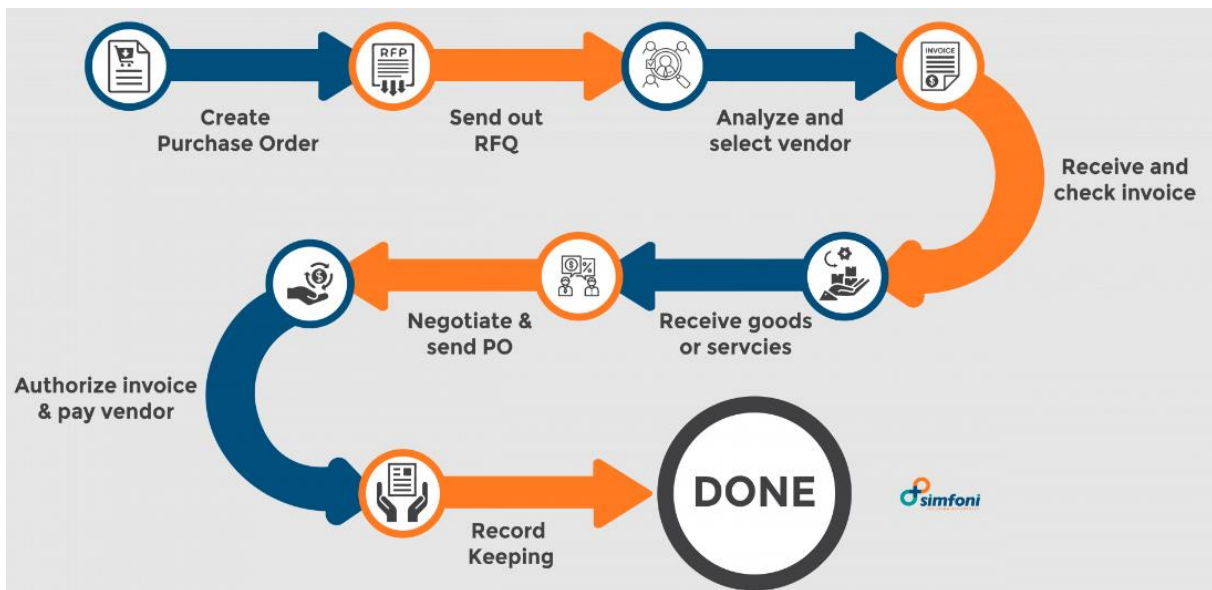
Slika 3. Proces nabave.

Na slici 3. predložen je proces nabave po koracima. Prvi korak sastoji se od kreiranja naloga, zatim se šalje zahtjev za ponudu na kojemu su predložene opcije cijena za tražene proizvode ili usluge. Nakon toga se analiziraju te odabiru dobavljači te se zaprima i provjerava račun. Nakon provjere i primitka računa zaprimaju se potraživanja dobra te se pregovara i šalje narudžbenica nakon čega dolazi do aktivnosti plaćanja i vođenja evidencije.