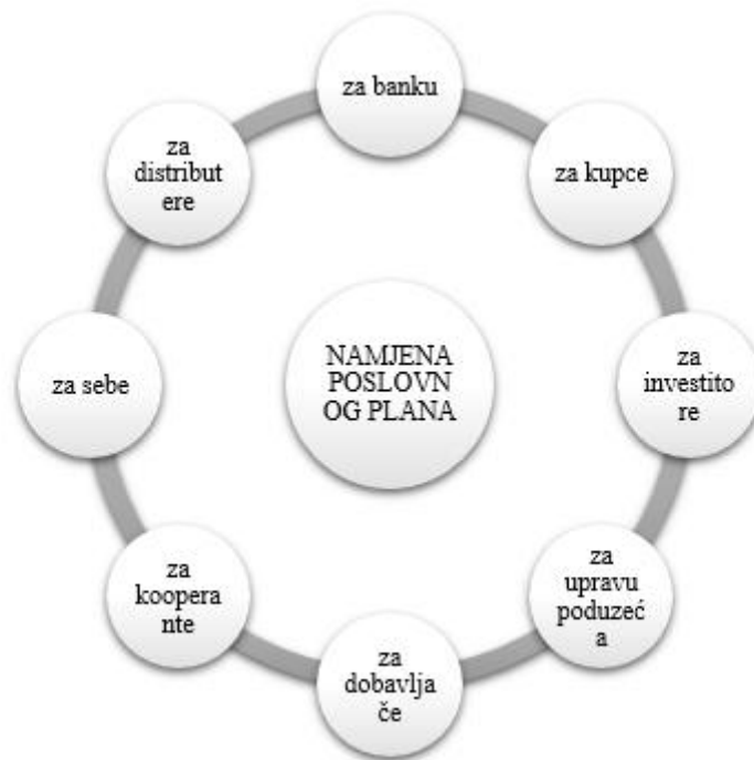
Slika 3. Namjena poslovnog plana