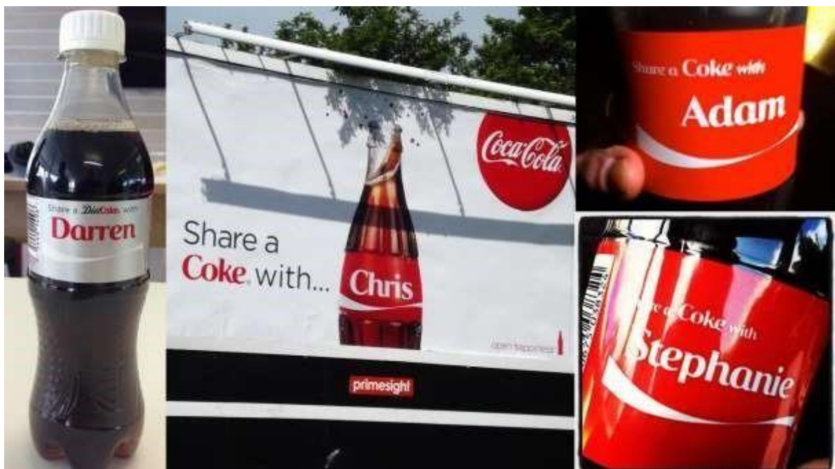
Slika 1. Oglašavanje Coca Cole

Kako bi zadržali zamah, kupci su zamoljeni da na društvenim mrežama podijele slike na kojima uživaju u piću uz svoju personaliziranu bocu te su na taj način kupci Coca Cole ušli su u ulogu oglašivača. Na slici 1. je prikazano oglašavanje Coca Cole.