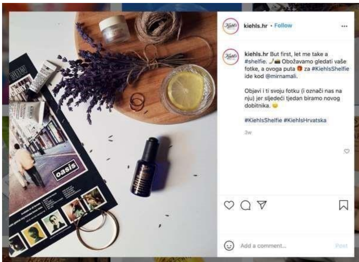
Slika 2. Primjer hashtag kampanje