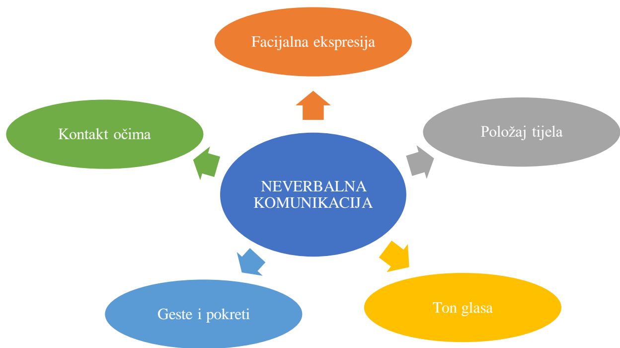
Slika 2. Neverbalna komunikacija

„Neizostavni dodatak verbalnoj komunikaciji, kojom se u prvom redu prenose informacije, je neverbalna komunikacija koja tim informacijama dodaje emocije i stav, što je u mnogim slučajevima čini i važnijom komponentom od verbalne“ (Klemenić, Đorđević i Braš, 2016:292 prema Mast, 2007). Na slici 2. navest će se oblici neverbalne komunikacije.