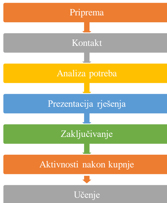
Slika 3. Prodajni proces

Osobna prodaja odvija se između prodavača i kupca te se tijekom nje ostvaruje izravan kontakt između kupca i prodavača. Prodavači, tijekom osobne prodaje, imaju priliku kupcu pristupiti individualno te kroz komunikaciju s kupcem koja se odvija u nekoliko faza prodajnog razgovora pomoći kupcu i potaknuti kupca da kupi proizvod/odluči se na korištenje određene usluge. Tipični prodajni proces prikazan je na slici 3., a potom će se objasniti tijek komunikacije u pojedinoj fazi prodajnog procesa.