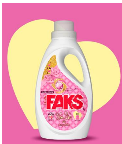
Slika 2 Faks helizim gel Shù Shù