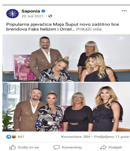
Slika 5 Objava suradnje Saponije i Maje Šuput na službenom Facebook profilu Saponije

Saponia tijekom cijele kampanje komunicira sa svojim potrošačima putem društvenih mreža te o svim aktivnostima ih informira putem Facebooka, Instagrama, YouTubea, LinkedIna. Osim na službenim profilima Saponije informacije o aktivnostima kampanje objavljene su i na društvenim mrežama brend ambasadorice Maje Šuput. Na slici 5 je prikazana objava na službenom Facebook profilu Saponije o početku suradnje Saponije i Maje Šuput.