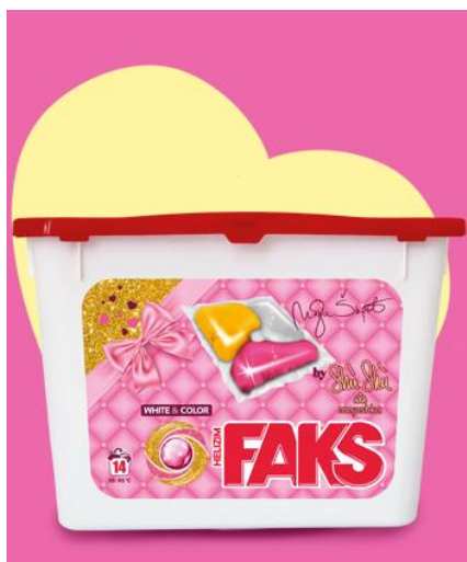
Slika 3 Kapsula Faks helizim Shù Shù

Saponia (2021b) ističe Faks helizim Shù Shù White&Color kapsule za pranje bijele i šarene odjeće sa pojačanom snagom pranja i uklanjanja mrlja. Također učinkovito štede energiju pri niskim temperaturama, a s novom formulom koja je obogaćena posebnim dodacima osigurava potpunu zaštitu boje i njegu vlakna odjeće. Faks helizim Shù Shù White&Color kapsule su kao i ostali proizvodi kampanje bazirane na notama parfema Shù Shù po izboru Maje Šuput.