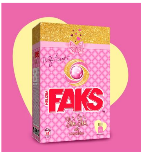
Slika 1 Faks helizim Shù Shù

Saponia (2021b) smatra kako zahvaljujući vrhunskoj kvaliteti nove formule Smart Clean, Faks helizim Shù Shù osigurava najvišu razinu čistoće rublja, a vrlo učinkovito uklanja sve vrste mrlja, posebno pri niskim temperaturama pranja. Također bitno je istaknuti kako sadrži veganski i prirodni sapun koji prodire tijekom pranja i štiti boju vlakna i samu tkaninu. Upravo ono što ga ističe i na što je Faks helizim Shù Shù baziran na notama mirisa Shù Shù po izboru pjevačice i voditeljice Maje Šuput, a utjelovljuje luksuz i ekskluzivnost. Blago citrusan, slatki cvjetni miris u deterdžentu širi miris čistoće i ljubavi što Saponija s ponosom ističe. Na slici 1 prikazan je Faks helizim Shù Shù.