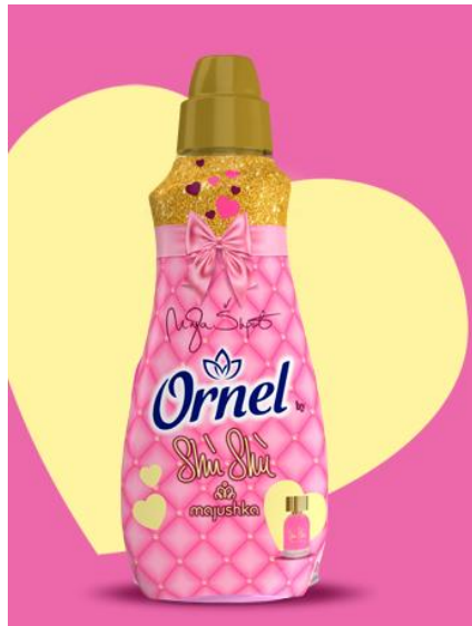
Slika 4 Ornel Shù Shù

osigurava i potpunu zaštitu tkanine. Kada se nosi omiljeni odjevni predmet, Ornel svakim pokretom tijekom oslobađa dašak citrusno-slatke cvjetne kompozicije, pružajući na taj način odjevnom predmetu neodoljiv luksuzan osjećaj. Ornelom Shù Shù potrošači su pozvani da uđu u svijet luksuza i uživaju u svakom trenutku te da izraze svoju osobnost i uživaju u svim osjetilima na Ornel način. Na slici 4 prikazan je Ornel Shù Shù.