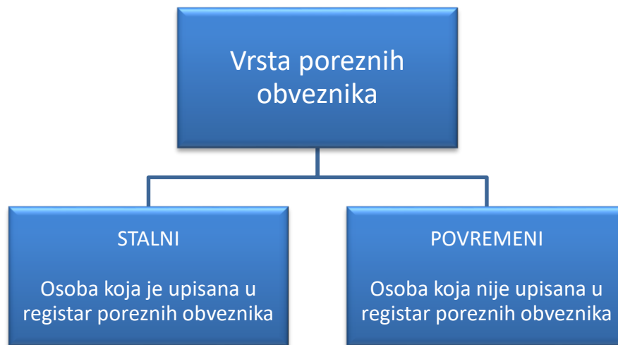
Slika 1. Vrste poreznog obveznika (izrada autora prema: Čevizović i sur., 2017).

Porezne obveznike poreza na dodanu vrijednost općenito možemo podijeliti u dvije skupine: