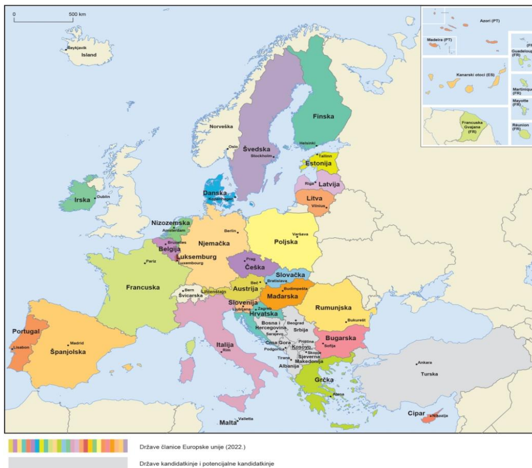
Slika 1. Geografska karta država članica Europske unije