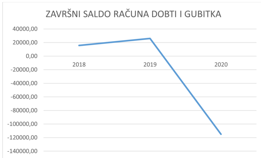
Grafikon 1. 2 Prikaz završnog salda računa dobiti i gubitka u 2018., 2019. i 2020. godini., Izrada autora., Prema računovodstvenim podacima iz poduzeća Mako d.o.o

poduzeće je pokrenulo svoj prvi web shop. Omogućile su prodaju svojih dobara udaljenim kupcima koji sada ne moraju i ne mogu ići u trgovinu nego mogu njihovim proizvodima pristupiti uz samo par klikova.