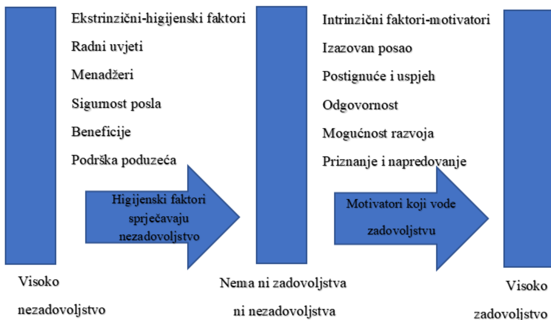
Slika 2. Dvofaktorska teorija motivacije (izrada autora)