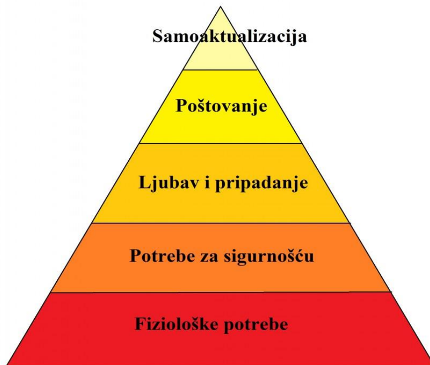
Slika 1. Teorija potreba.

Za ovu teoriju može se reći da je najpoznatija među teorijama motivacije, spada u skupinu sadržajnih teorija motivacije, a njezin ustanovitelj je Abraham Maslow. Maslowljeva teorija se pokazala kao najutjecajnija teorija kada je riječ o istraživanju ljudskog ponašanja, kako u osobnom životu, tako i u poslovnom svijetu (Požega, 2012).