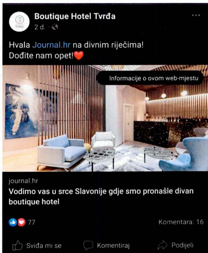
Slika 3 Preporuka Boutique Hotel Tvrđa (Boutique Hotel Tvrđa,2022.)

Nešto manji hotel se smjestio u starom gradu, u Tvrđi. Boutique hotel Tvrđa je luksuzni hotel s 15 soba i 30 kreveta. Interijer je kombinacija baroknog ugođaja u čijem se okruženju nalazi i modernog dizajna. Gosti se mogu koristiti saunom, knjižnicom i restoranom, a ono što ovaj hotel čini posebnim je otvoreni bazen i jacuzzi na vrhu zgrade s pogledom na stari grad. Iz prethodne tablice se može uočiti da je cijena najjeftinija od tri ponuđena smješta i to s najboljom ocjenom. U recenzijama je najviše hvaljena osoblje koje je susretljivo i nasmijana te sadržaj koji se nalazi na krovu. (Booking, 2022.) Web stranica je uredna, ali sažeta. Samo su navedene glavne informacije. Koriste Facebook i Instagram od društvenih mreža. Objave nisu toliko česte, ali su kvalitetne. Na slici br.3. je prikazano kako na Facebook-u dijele članak gdje ih druge stranice preporučuju za odmor. Ovo je prikaz da imaju dobru reputaciju i da su prepoznatljivi i na dalje.