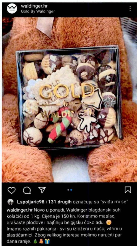
Slika 4 Objava na Instagramu - suvenir (Prema Waldinger.hr, 2021.)

Hotel Waldinger zauzima mjesto kao prvi hotel s četiri zvjezdice u Osijeku. U kategoriji malih obiteljskih hotela osvojio je 2014. godine drugo mjesto u kontinentalnoj Hrvatskoj. Hotel se nalazi u stogodišnjoj secesijskoj zgradi koja je zaštićena kao ambijentalni i kulturni spomenik. Nešto manji hotel koji raspolaže s 29 kreveta nudi primamljiv sadržaj. Uz restoran Club Waldinger posjeduje i finskom saunom te fitness dvoranom, a gotovo sve sobe sadrže hidromasažne kade, a najveća soba ima i jacuzzi. Poznata je i Kavana Waldinger s svojim interijerom starih „bečkih kavana“ gdje se može probati praline Waldinger i torte uz različiti izbor kava. Nagrađivane slastice nikoga neće ostaviti ravnodušne. U hotelu se mogu održavati vjenčanja, poslovni sastanci, seminari, konferencije, edukacije, domjenci u dvoranama različitih veličina. Posebne privatne proslave, ručkove ili večere se mogu održati u restoranu „Gradski podrum“. (Waldinger, 2022.) Web stranica sadrži sve informacije. Na društvenim mrežama su aktivni, hotel se može pronaći na Facebooku i Instagramu. Na sljedećoj slici br.4. prikazana je objava na Instagramu. Na ovoj objavi je slika kekسا koje su imali u ponudi za kupiti kao mali suvenir Hotela Waldingera.