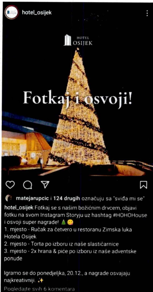
Slika 2 Nagradna igra - Hostel Osijek {prema hostel_osijek, 2021.}

Na svim recenzijama se najviše ističe ljubaznost i uslužnost osoblja, koji su na raspolaganju 0-24 za sva pitanja i nedoumice. (Booking, 2022.)