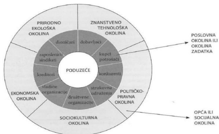
Slika 1. Segmenti okoline poduzeća.

Eksterna okolina je ona okolina koja obuhvaća segmente koji indirektno utječu na poslovanje organizacije. Podijeljena je na dva dijela, a čine ju poslovna okolina ili okolina zadatka i opća ili socijalna okolina (slika 1).