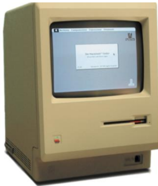
Slika 3: Prvo računalo Macintosh