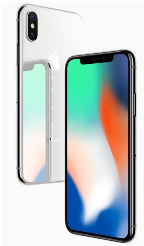
Slika 5: iPhone X

Za iPhone X se ne smatra da je inovacija nego on predstavlja jedan od niza mobilnih uređaja tvrtke Apple. Prethodnik iPhonea X bili su modeli iPhone 7 i iPhone 7 plus, a ovaj uređaj obilježava desetu godišnjicu iPhonea pa iz tog razlika oznaka X. Apple firma za cilj ima impresioniranje svojih potrošača, a slikom 5. prikazan je model iPhone X.