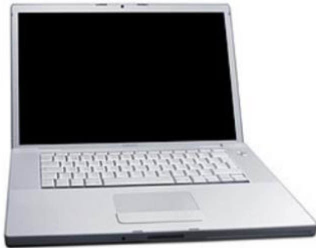
Slika 4: MacBook Pro

Godine 2006. započela je proizvodnja Mac računala pod nazivima MacBook Pro (slika 4) i iMac pomoću Intel tehnologije. Osim toga, 2007. godine dolazi do promjene imena iz Apple Computer Inc u današnji poznati naziv Apple Inc iz razloga što računala nisu više bila fokus firme (Apple Inc).