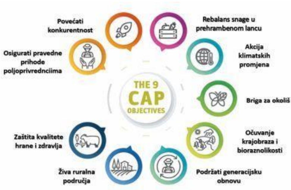
Slika 2. Devet ciljeva Zajedničke poljoprivredne politike

Primarni ciljevi Zajedničke poljoprivredne politike objedinjuju sve gospodarske djelatnosti koje politika financira i koje poljoprivredna politika želi poboljšati u pojedinim zemljama. Svih devet zajedničkih ciljeva zajedno žele ostvariti savršenu poljoprivredu unutar zemlje. Zaštitom kvalitete hrane i zdravlja, podržavanjem generacijske obnove, očuvanjem krajobraza i bioraznolikosti, brigom za okoliš, akcijom klimatskih promjena te rebalansom snage u prehrambenom lancu ne obraća se pozornost samo na poljoprivredu već se pažnja stavlja na cjelokupnu prirodu i sva bogatstva unutar nje (Ips konzalting, 2020).