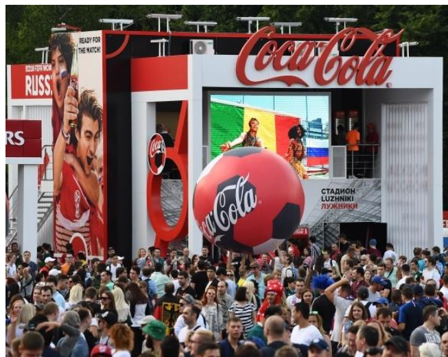
Slika 12. Coca-Cola display na SP-u u Rusiji 2018.

Coca-Cola je snažno uključena u sportski marketing, u partnerstvu je s organizacijama kao što je FIFA. FIFA organizira Svjetska prvenstva u nogometu te je surađivala sa Coca-Colom kako bi pokrenuli dinamičnu marketinšku kampanju u ljeto 2018 za SP u Rusiji. Njihov pristup bio je usmjeren na održavanje navijača i onih koji su uključeni u turnir te im pružiti, čarobno iskustvo. Ciljali su na uključivanje, održivost i razvoj nogometa mladih. Marka shvaća goleme prednosti koje takva utjecajna partnerstva mogu imati, omogućujući robnoj marki pića ciljanje velikog broja demografskih skupina, dok ljudi diljem svijeta prate Svjetsko nogometno prvenstvo. Štoviše, Coca-Cola je 2019. godine postala sedmi službeni partner Engleske Premier lige koja je najjača liga svijeta. Uz brojne napore koje ulažu na glavnim terenima koji su globalno prepoznatljivi, financiraju i razne kampove za mlade nogometaše diljem svijeta, osobito u Africi i Južnoj Americi.