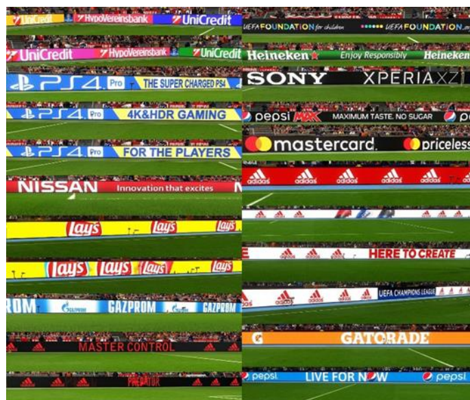
Slika 4. Primjer LED oglašavanja.