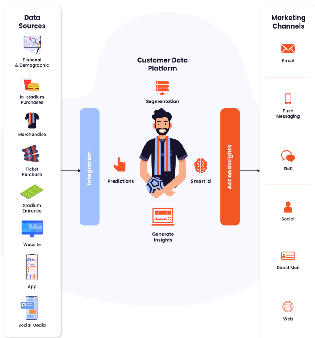
Slika 12. Primjer rada CDP-a

Uzmimo za primjer nogometni klub koji želi povećati sponzorsku vrijednost svojim partnerima, neki od ključnih pokazatelja koji bi trebali pratiti su: