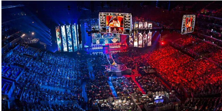
Slika 13. Organizacija eSports događaja.