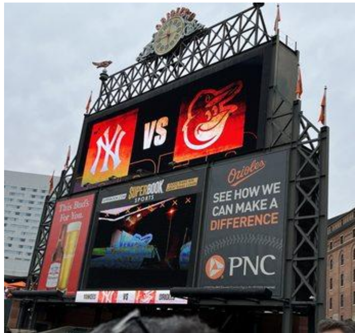
Slika 3. Primjer billboarda u SAD-u.

poruke. Billboardi su često vidljivi tijekom prijenosa utakmica, što omogućuje izlaganje robnih marki velikom broju gledatelja.