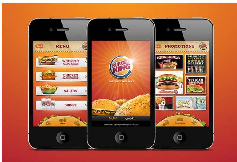
Slika 2: Burger King aplikacija

Burger King mobilna aplikacija omogućuje kupcu brz i jednostavan pregled najnovijih ponuda, akcijskih ponuda, posebne popuste, kupone, kreiranje kombinacija po želji. Aplikacija pruža uvid u cjelokupnu ponudu Burger Kinga te narudžbu odabranog proizvoda. Ukoliko kupac želi vlastitu kombinaciju aplikacija mu nudi razne mogućnosti od klasičnog Whoppera do hamburgera na biljnoj bazi. Proizvodi se mogu udovoljiti zahtjevima svakog pojedinog kupca. Ispod svakog proizvoda pišu njegovi sastojci te nutritivne vrijednosti. Također se nalazi karta sa prikazanim restoranima u Hrvatskoj. Kako bi mogli iskoristiti kupone potrebno je registrirati se preko e – mail adrese, Apple ID-a te Facebook ili Google računa, u pojedinom restoranu se kuponi mogu upotrijebiti prikazivanjem QR koda kupona.