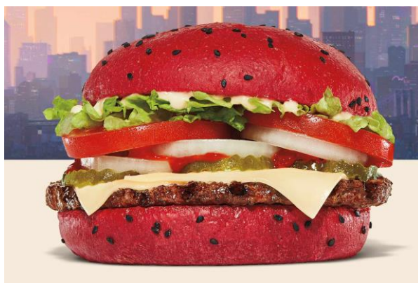
Slika 5: Spider - Verse Whopper

Povodom izlaska filma Spider – Man: Across The Spider – Verse, Burger King je u svoju ponudu dodao „Spider – Verse“ Whopper. Haburger je estetski prilagođen glavnom junaku filma. Lepinja je crvene boje posipana crnim sjemenkama što podsjeća na kostim Spidermana, uz to je na čaše pića naljepio poster s njegovim likom (Santiago, 2023).