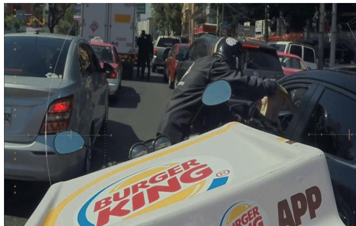
Slika 3: Traffic Jam Whopper

Promotivna kampanja „Traffic Jam Whopper“ bio je prava senzacija, namijenjena vozačima u prebukiranim dijelovima Mexico Citiya. „Traffic Jam Whopper“ pruža vozačima mogućnost da naruče hranu putem mobilne aplikacije te da im se ona dostavi motociklom u automobil. Služeći se podacima poput lokacije i brzine, reklamne ploče su duž rute prikazivale raspoloživo vrijeme u prometu i koliko su vozači imali vremena za slanje narudžbi direktno do vlastitih automobila. Isporuka hrane na motociklima u kombinaciji s individualnim porukama na elektroničnim reklamnim panoima bio je pun pogodak. Projekt je donio povećanje na broju narudžbi za dostavu hrane za 63% u prvom tjednu i dovelo do 44 puta većeg broja preuzimanja aplikacije Burger King. Afirmirao je uslugu na digitalnim platformama kao što je Wazea i elektroničkim oglasima na otvorenom (Williams, 2019).