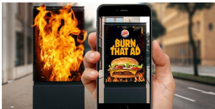
Slika 4: Burn That Ad