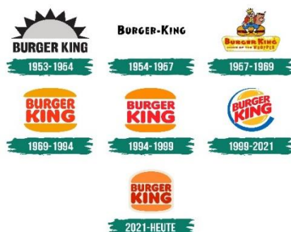
Slika 1: Logo Burger Kinga tokom godina