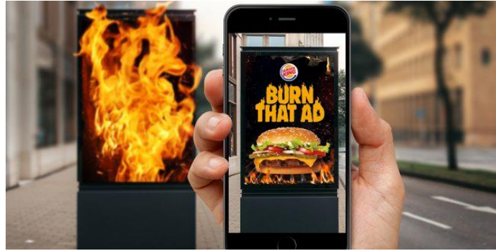
Slika 4: Burn That Ad