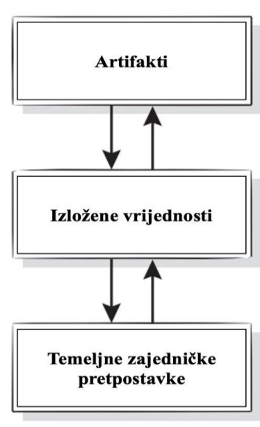
Slika 2. Razine organizacijske kulture