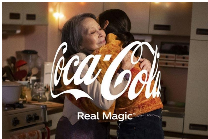
Slika 2 Blagdanska kampanja Real Magic, izvor: manilatimes.net, pristupljeno 23.6.2023.