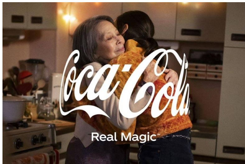
Slika 2 Blagdanska kampanja Real Magic