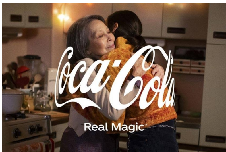
Slika 2 Blagdanska kampanja Real Magic