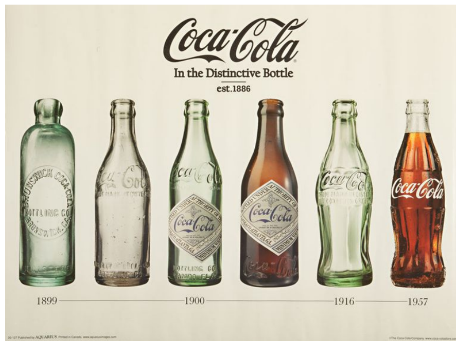
Slika 1 Primjer promjene oblika boce Coca Cole tijekom vremena