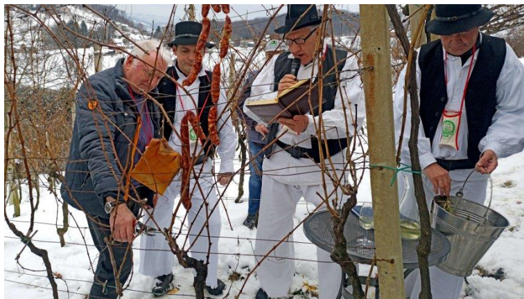
Slika 6 Vincekovo

„Ponegdje se prvi posjet vinogradima u novoj godini obavi već za blagdan Triju kraljeva, ali najprikladniji nadnevak za to je 22. siječnja, na spomendan Sv. Vinka, Vinceka, Vincencija, Vinceška ili kako se u pojedinom kraju naziva taj svetac“ (Gašparec-Skočić, Bolić, 2006:263). Tog dana se vinova loza pošškropi starim vinom i o trs objese kobasice, kulen, slanina i još razne delicije. Tim običajem se simbolično izaziva plodnost u narednoj godini. Uz to, odreže se nekoliko mladica koje se stave u posudu s vodom, kako bi se nakon izbijanja izdanaka prorekla iduća vinska godina. Obredi se razlikuju od kraja do kraja. U Iloku se Vincekovo slavi ujutro, dopodne, vinogradi se tada blagoslivljaju i održava se sveta misa, a o trs se objese npr. ljute srijemske kobasice. Slično je i u erdutskim, orahovičkim te đakovačkim vinogradima. U gotovo svim vinogradima se na spomendan sv. Vinka održava neki obred. Domaćin često drži govor pred ljudima koji su se našli u njegovom vinogradu. „Ja tebe darivam vinom, a ti mene novim grožđem i moštom“ (Gašparec-Skočić, Bolić, 2006:263). Prvi dio ceremonije održava se u otvorenom vinogradu, a drugi se odvija u vinskim podrumima.