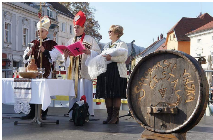
Slika 7 Samoborsko Martinje

na sjeveru. „Na Martinje se održavaju brojne svečanosti krštenja mošta, šaljivo oponašajući crkveni obred, na kojima se mošt proglašava vinom“ (Gašparec-Skočić, Bolić, 2006:265). U tom ironijskom prikazu krštenja mošta, odnosno njegove transformacije u vino sudjeluje kolona ljudi koja se sastoji od zvonara, sv. Martina biskupa, dva kanonika, dva ministranta i predvodnika grupe. Posljednih godina Martinje postaje poznati hrvatski običaj na koji dolazi sve više turista.