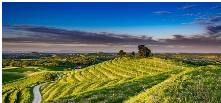
Slika 5 Međimurska vinska cesta

Veliku ulogu u vinskom turizmu imaju vinske ceste. One prolaze kroz vinograde, vinarije, kušaonice i druge turističke objekte. „Obilježene raznovrsnim i zanimljivim putokazima na cestovnim pravcima, oni prolaznike upozoravaju da se tu nalaze vinari, njihovi podrumi i klijenti, vinske kuće te kušaonice vina, pa i veći turističko-ugostiteljski objekti, koji su pripremljeni za prijam vinskih gostiju, zaljubljenika u vino, turističkih znatiželjnika i svih namjernika“ (Gašparec-Skočić, Bolić, 2006:259). Najpoznatija regija u Hrvatskoj po vinskim cestama je Istra. Dobrota (2020) navodi kako je 2019. godine Međimurska vinska cesta ocijenjena kao najbolja vinska cesta na svijetu. S obzirom na broj dolazaka gostiju u kriznoj 2020. godini, Međimurska županije je jedina imala veći broj dolazaka gostiju u usporedbi sa 2019. godinom.