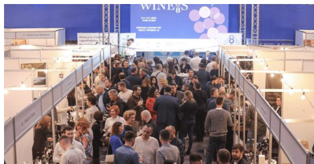
Slika 4 Wineos