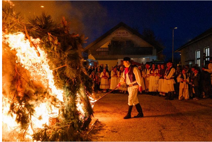
Slika 8 Jurjevo