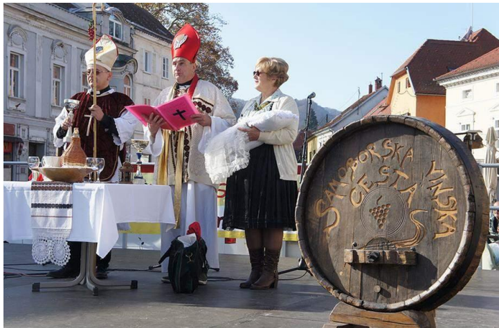
Slika 7 Samoborsko Martinje

na sjeveru. „Na Martinje se održavaju brojne svečanosti krštenja mošta, šaljivo oponašajući crkveni obred, na kojima se mošt proglašava vinom“ (Gašparec-Skočić, Bolić, 2006:265). U tom ironijskom prikazu krštenja mošta, odnosno njegove transformacije u vino sudjeluje kolona ljudi koja se sastoji od zvonara, sv. Martina biskupa, dva kanonika, dva ministranta i predvodnika grupe. Posljednih godina Martinje postaje poznati hrvatski običaj na koji dolazi sve više turista.