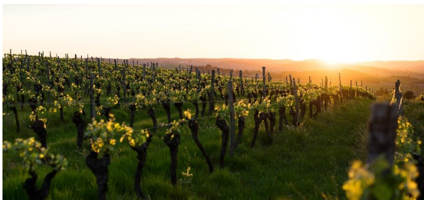
Slika 2 Moslavački škrlet

Podregija Moslavina smještena je oko Moslavačke gore. U njoj se uzgajaju autohtone sorte škrlet, frankovka, graševina, moslavac, pinot bijeli i sivi, razling rajnski... Najveći vinogradi su Voloder i Ivanić-Grad (1400 ha) te Čazma i Garešnica (580 ha), prema Gašparec-Skočić & Bolić (2006). U ovoj podregiji se nalaze i brojni manji vinogradi. Tlo je uglavnom ilovasto, klima je kontinentalna s godišnjom količinom oborina do 800mm. Posebnost na ovom području je škrlet, bogato autohtono vino.