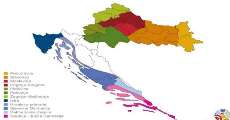
Slika 3 Hrvatske vinske regije