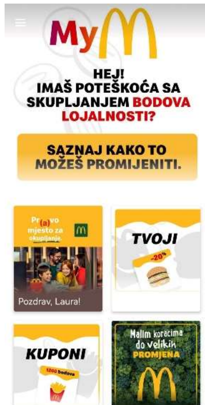
Slika 1 Mobilna aplikacija MyM