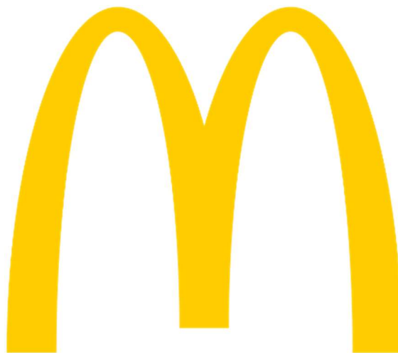
Slika 2 Logo McDonald'sa

Kombinacija ovih dviju boja izuzetno je snažna u privlačenju pozornosti. Sam logo McDonald'sa (slika 2) u kombinaciji je tih boja te je zbog toga i svjetski prepoznatljiv.