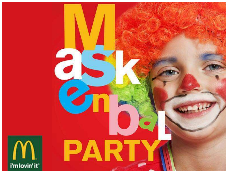
Slika 3 Plakat za Maskenbal

Organizacija ovakvog događaja financijski je izrazito teška te češće donosi lošiji nego bolji financijski rezultat, međutim ona utječe na imidž poduzeća. Utječe na dobar stav potrošača o organizaciji te zadržavanju potrošača i njihovom povećanju broja. (McDonald's, 2016).