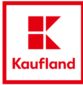
Slika 1. Logo Kauflanda (Kaufland, n.d.)