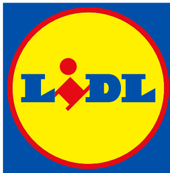
Slika 2. Logo Lidl (Lidl, n.d.)

Kako navodi portal Lidl (n.d.), u Neckarsulmu u Njemačkoj 1930. godine osnovana je tvrtka za veleprodaju prehrambenih namirnica Lidl & Schwarz KG. Prva Lidlova trgovina otvorena je 1973. godine u njemačkom mjestu Ludwigshafen-Mundenheim . U Hrvatskoj Lidl svojih 13 prodavaonica otvara 2006. godine. Od tada Lidl kontinuirano provodi strategiju ulaganja i širenja svoje prodajne mreže. Danas u Hrvatskoj Lidl ima 107 trgovina i dva logističko distributivna centra i oko 3200 zaposlenih. Uzimajući u obzir sve zahtjeve tržišta drže se svog osnovnog načela: ponuditi najbolji omjer cijene i kvalitete u svim segmentima asortimana. Temelj rada je djelovati s kupcem u središtu pažnje, odgovorno upotrebljavati sredstva te se prema kupcima, zaposlenicima i poslovnim partnerima odnositi s poštovanjem.