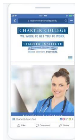
Slika 3. Slideshow oglas

Ovakva vrsta oglasa se smatra jednostavnim načinom za stvaranje video uradaka od kolekcija fotografija, tekstova ili video isječaka koji veće postoji. Ukoliko nemate vlastite slike, mogu se odabrati fotografije izravno iz upravitelja oglašavanja. Takav oblik oglašavanja ima faktor kretnje koji znatno privlači pažnju, ali isto tako ima puno manju širinu pa se vrlo brzo može učitati čak i onim korisnicima koji imaju sporiju internetsku vezu (Viher, 2021).