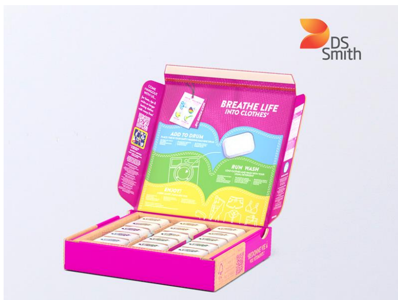
Slika 3. Vanish Multipower tabs kutija