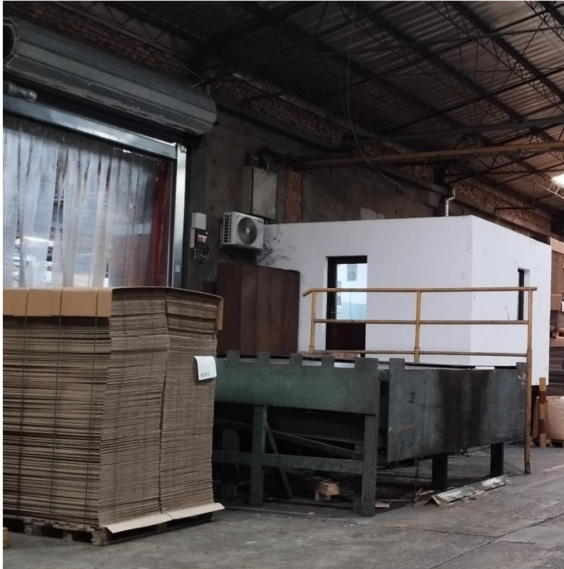
Slika 6. Izlazna rampa u proizvodnji ambalaže.