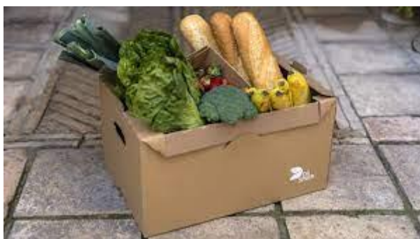
Slika 4. Greentote.

Drugi primjer je zamjena plastičnih vrećica za namirnice s proizvodom nazvanim GreenTote®, prikazano na slici 4.. Ova ambalaža je otporna na vlagu i može se 100% reciklirati i ponovno koristiti do 100 puta. Dostupna je u različitim veličinama i može primiti znatno više namirnica u usporedbi s tipičnim plastičnim vrećicama. Također, njezin dizajn omogućuje povezivanje s drugim kutijama iste vrste, osiguravajući siguran i praktičan transport (DS Smith, 2023c).