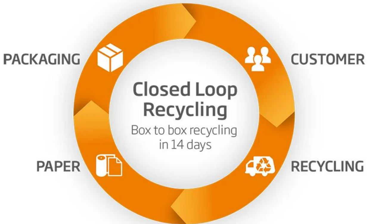
Slika 9. DS Smith-ov kružni model poslovanja.