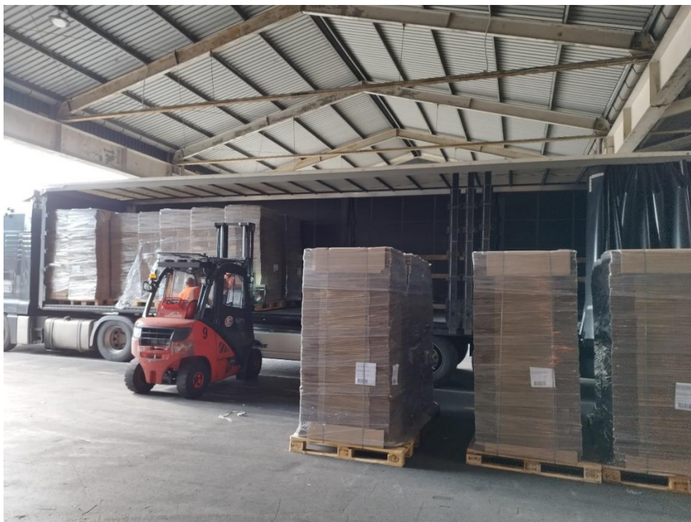
Slika 7. Utovar ambalaže u kamion.