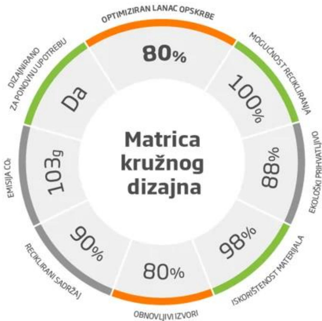
Slika 10. Matrica kružnog dizajna: 8 ključnih pokazatelja.