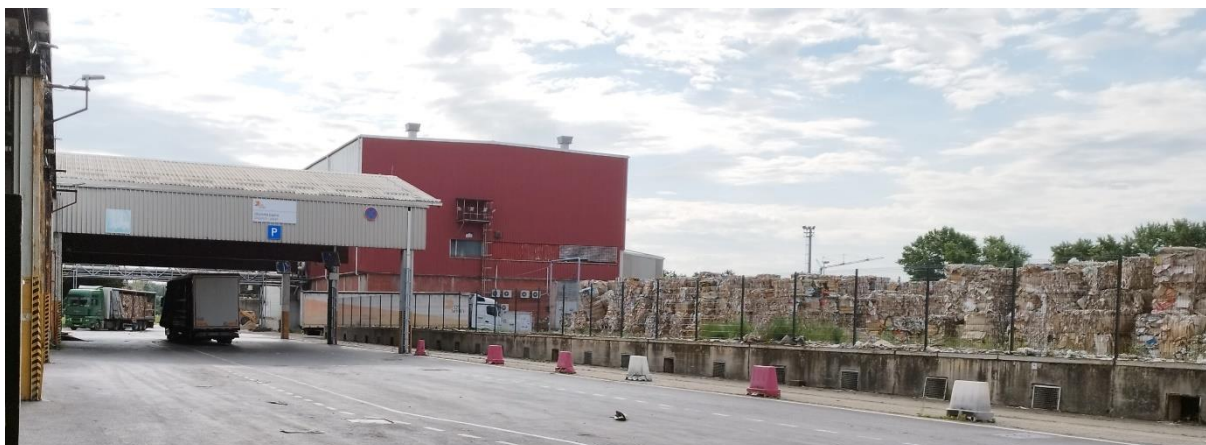
Slika 8. Unutarnji transport - stari papir i reciklaža.

Što se tiče unutarnjeg transporta, problem je u tome što kamion, nakon što se u njega utovari stari papir, mora napraviti puni krug oko zgrade skladišta i obje proizvodnje kako bi dovezao stari papir do stroja za recikliranje. Na slici 8. dolje prikazano je skladište starog papira (desno) i istovar starog papira kod stroja za recikliranje (lijevo). Također je vidljiv kamion kako ulazi u skladište starog papira (na sredini).