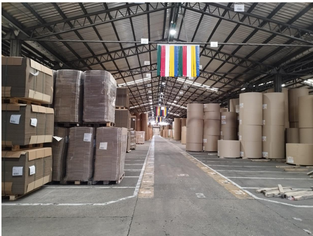
Slika 5. Skladište rola papira i ambalaže

Već je spomenuto da skladišta proizvode ogromne količine otpada i da se održivost skladišta postiže korištenjem solarnih panela, LED rasvjetom, pametnim sustavima upravljanja energijom i sl. Prema tome napominje se da su u DS Smith Belišće postavljeni solarni paneli kako bi se iskoristila obnovljiva energija za proizvodnju papira i ambalaže. Također imaju LED rasvjetu. Nadalje, divizija proizvoda od papira i divizija ambalažnih rješenja smještene su na istoj lokaciji. Štoviše, proizvodnja papira i proizvodnja ambalaže dijele jedno zajedničko skladište, pola skladišta je skladište rola papira a druga polovica je skladište ambalaže. Time se štedi vrijeme transporta i manja je emisija štetnih plinova jer nema dodatnog transporta. Također, oba skladišta imaju velik koeficijent obrtaja robe. To im omogućuje da imaju manji skladišni prostor što znači manji troškovi zaliha i manje otpada. Prema navedenom može se reći da imaju „zeleno“ skladište. Slika5 dolje prikazuje skladište rola papira (desno) i skladište ambalaže (lijevo), također je vidljiva LED rasvjeta u skladištu.