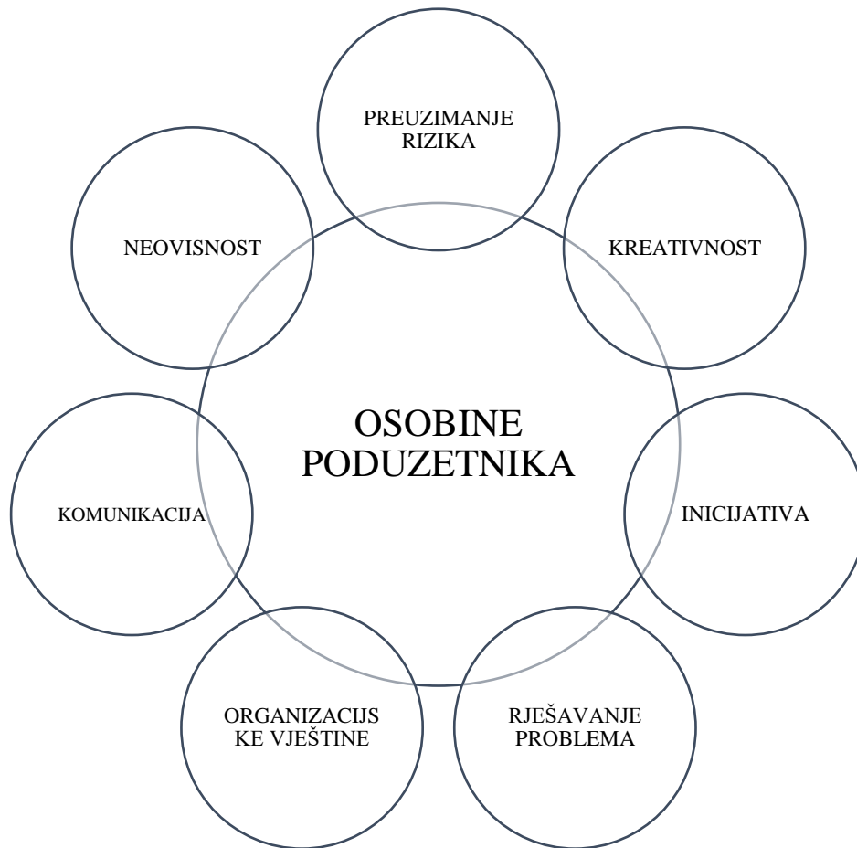
Slika 1. Osobine poduzetnika

Izrada autora prema Škrtić, Mikić (2011).