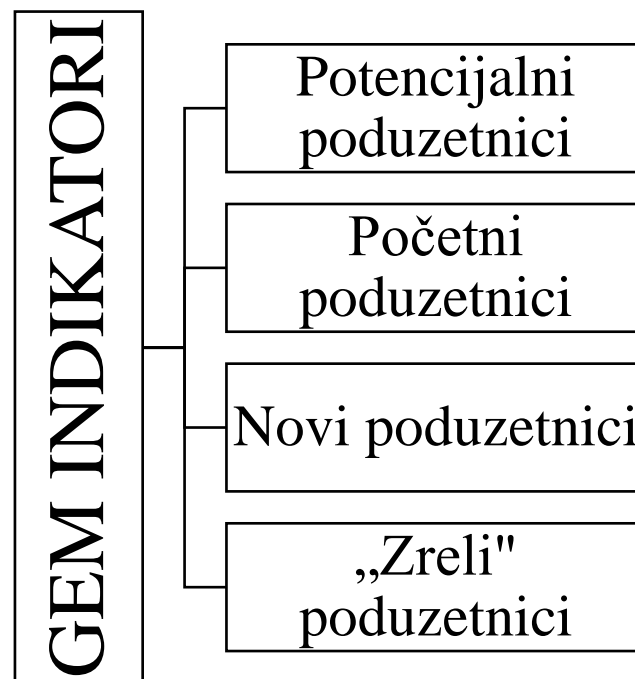
Slika 2 GEM indikatori poduzetničke aktivnosti

GEM indikatori poduzetničke aktivnosti navedeni su na slici 2.(Singer, 2022)