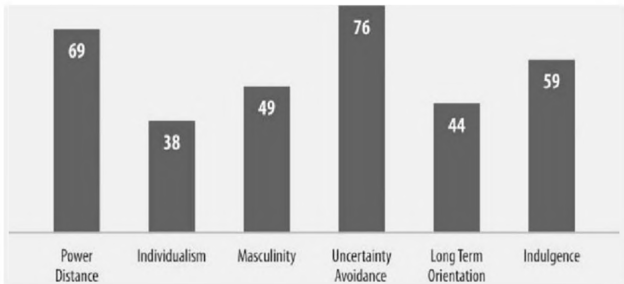
Slika 1. Hofstede-ov 6-D model brazilske kulture. (De Salles Canfield i Basso, 2016)

Analiza Geerta Hofstedeja za Brazil pokazuje sličnosti s njegovim latinoameričkim susjedima. Najviši rang izbjegavanja neizvjesnosti ukazuje na visoku zabrinutost za pravila, propise, kontrole i probleme s sigurnošću karijere. Društvo koje ne prihvaća promjene je spremno i nesklono riziku. Velika distanca moći sugerira da se dopušta rast nejednakosti moći i bogatstva u brazilskom društvu. Visoko rangiranje dugoročne orijentacije znači da Brazil poštuje tradiciju i podržava snažnu radnu etiku u kojoj se očekuju dugoročne nagrade kao rezultat trenutnog rada.