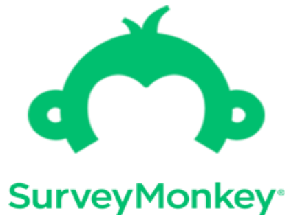
Slika 2. Logo Survey Monkey-a (InsightPlatforms, 2018)

Uz zgradu sjedišta od 200.000 četvornih stopa u San Mateu u Kaliforniji, SurveyMonkey ima urede u Portlandu, Seattleu, Dublinu, Ottawi, Londonu i Sydneyu. Od 2022. SurveyMonkey je zapošljavao oko 1400 ljudi.