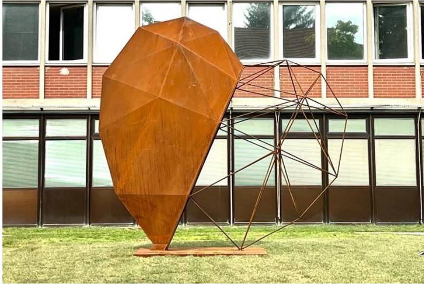
Slika 1. Simbol tvrtke Podravka d.d.