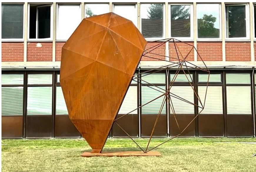
Slika 1. Simbol tvrtke Podravka d.d.