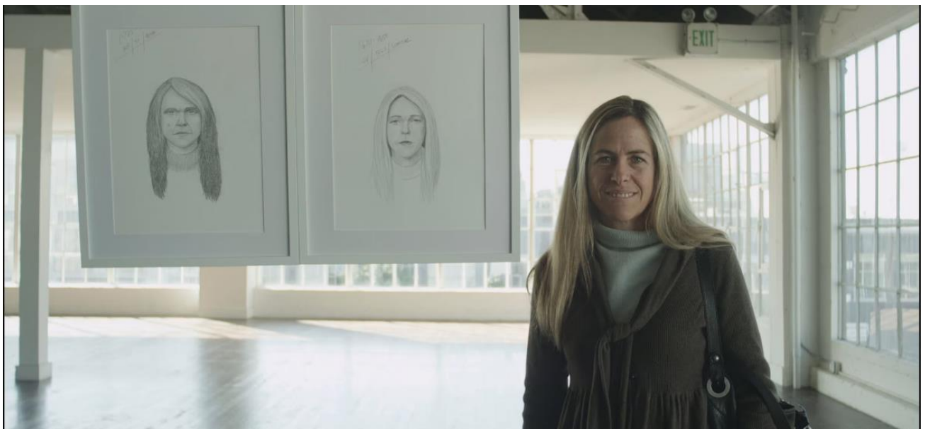
Slika 3. Dove Real Beauty Sketch, Dove campaigns.

Dove ima nekoliko viralnih kampanja koje su osmišljene tako da povećavaju samopouzdanje kod žena. Jedna od njihovih poznatijih kampanja, svakako je ona iz 2004. godine naziva Real Beauty Sketch čija je svrha bila dokazati ženama da su ljepše nego što misle.