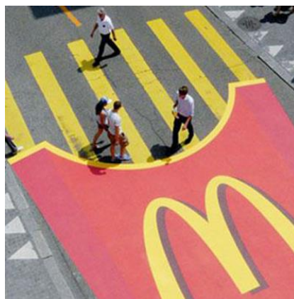
Slika 1. Prikaz Gerilla marketinga.