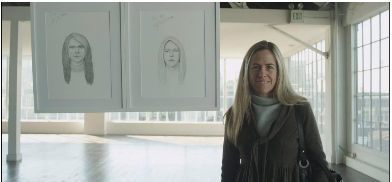
Slika 3. Dove Real Beauty Sketch, Dove campaigns.

Dove ima nekoliko viralnih kampanja koje su osmišljene tako da povećavaju samopouzdanje kod žena. Jedna od njihovih poznatijih kampanja, svakako je ona iz 2004. godine naziva Real Beauty Sketch čija je svrha bila dokazati ženama da su ljepše nego što misle.