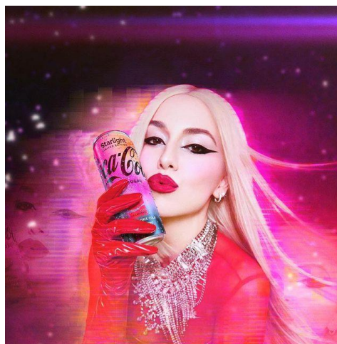
Slika 5. Ava Max Performance (Propaganda od the new Coca Cola drink).

Prilikom promoviranja ograničenog izdanja, Coca – Cola omogućila je svim svojim kupcima koji kupe novu limenku kod koje je bilo potrebno skenirati te bi tako korisnici dobili pristup virtualnom koncertu u Metaverseu . U ovoj kampanji Coca – Cola je za virtualni koncert angažirala svjetski poznatu pjevačicu Avu Max.