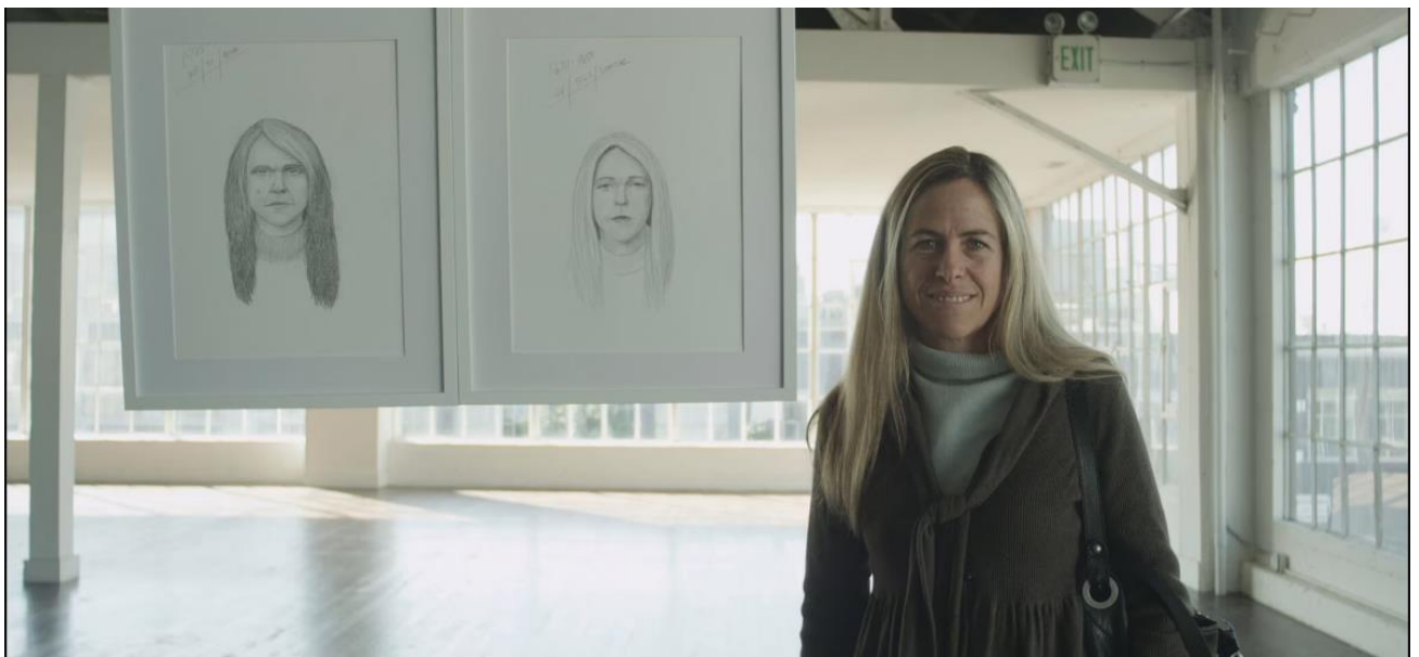
Slika 3. Dove Real Beauty Sketch, Dove campaigns.

Dove ima nekoliko viralnih kampanja koje su osmišljene tako da povećavaju samopouzdanje kod žena. Jedna od njihovih poznatijih kampanja, svakako je ona iz 2004. godine naziva Real Beauty Sketch čija je svrha bila dokazati ženama da su ljepše nego što misle.