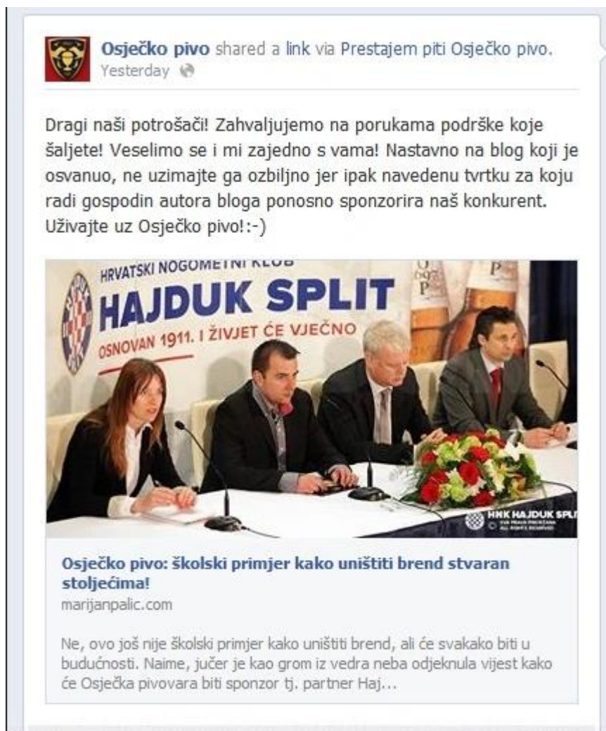
Slika 7. Napad je najbolja obrana, ili možda nije?

Na kraju cijele ove priče, Osječka pivovara stekla je negativan publicitet među svojim potrošačima, opao joj je broj korisnika, a samim time vjerojatno i zarada. Rezultat svega ovoga bio je prekid dogovorene suradnje s Hajdukom i prije samog isteka ugovora.