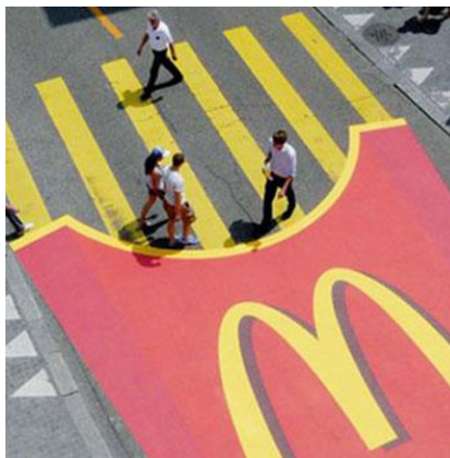
Slika 1. Prikaz Gerilla marketinga.