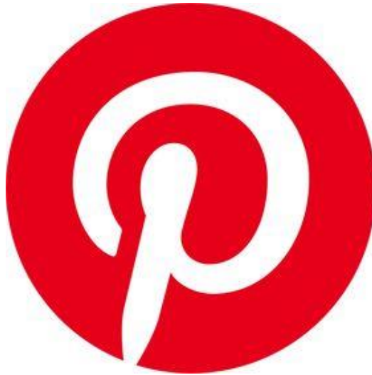
Slika 2. Ikona aplikacije Pinterest.

Na temelju prethodno navedenih društvenih mreža, vidljivo je kako poslovni subjekti imaju veliki izbor prilikom odabira na kojoj društvenoj mreži će biti prisutni kako bi ostvarili što bolji i kvalitetniji odnos sa širom javnosti. Kod odabira društvene mreže važno je da poslovni subjekti ne vode samo računa o tome koja poslovna mreža ima najveći broj korisnika, nego je važno da vode računa o svrsi određene društvene mreže. Na temelju svrhe određene društvene mreže oni mogu doznati osnovne karakteristike korisnika te društvene mreže koji je ujedno i njihov potencijalni korisnik, ako specifičnosti društvene mreže odgovaraju karakteristikama poslovnog subjekta i njegove ciljne skupine. U konačnici, poslovni subjekt treba biti aktivan na nekoliko društvenih mreža kako bi ostvario što bolju komunikaciju i saznao što više karakteristika o njegovoj ciljnoj skupini, odnosno svakom korisniku pojedinačno.