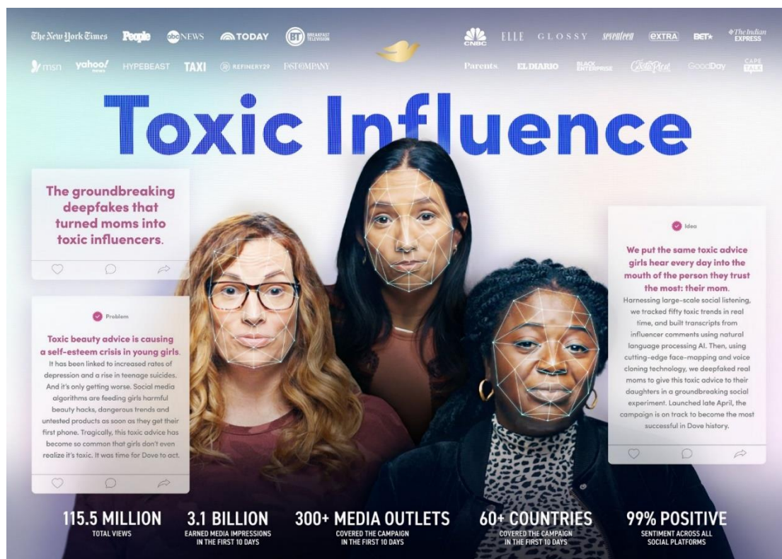
Slika 4. Dove Toxic Influence.

Dove je jedan od brendova koji koristi stvarne društvene probleme kako bi kreirao promotivne kampanje te tako utjecao na ljude bez obzira koristili oni njihove proizvode ili ne. Baš kako i sama njihova misija kaže cilj im je prvenstveno pomoći ženama i pomoći pri razvoju njihovog samopouzdanja. Kreiranjem promotivnih kampanja u kojima se izazivaju različiti emotivni osjećaji uvelike igra ulogu u stvaranju viralnih kampanja, a kreiranje važnih poruka na kraju promotivnih videa svakako utječe na širu javnost i potiče pojedince na akciju odnosno dijeljenje promotivnih videa.