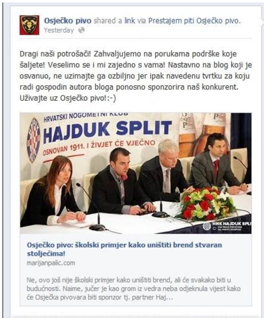
Slika 7. Napad je najbolja obrana, ili možda nije?

Na kraju cijele ove priče, Osječka pivovara stekla je negativan publicitet među svojim potrošačima, opao joj je broj korisnika, a samim time vjerojatno i zarada. Rezultat svega ovoga bio je prekid dogovorene suradnje s Hajdukom i prije samog isteka ugovora.